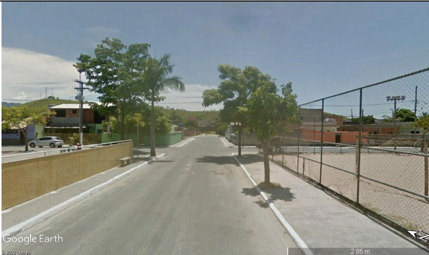
Imagem 7: Rua Alcebiadina Demier Brust (coordenadas UTM 23K 788339.71 m E 7509694.75 m S).