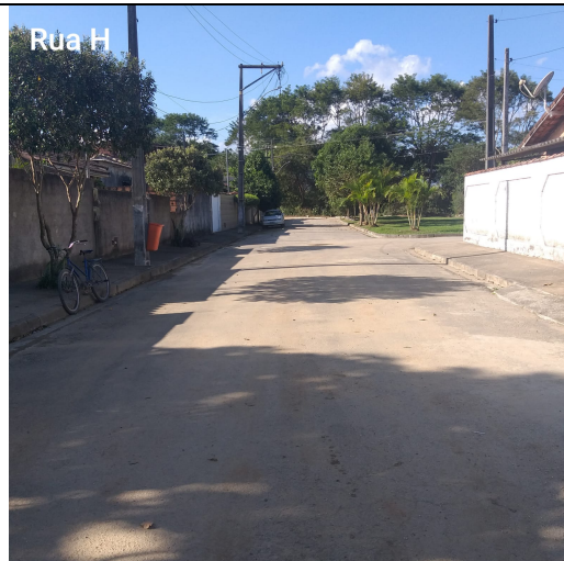
Imagem 20: Rua Eliezer Maia Bento Santana (coordenadas UTM 23k 788329.96 m E 7508754.65 m S).