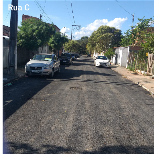
Imagem 15: Rua Marines Fátima dos Santos (coordenadas UTM 23k 788232.45 m E 7508928.39 m S).