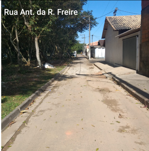
Imagem 12: Avenida Antonio da Rocha Freire ( coordenadas UTM 23k 788353.05 m E 7508938.82 m S).