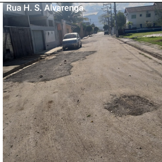
Imagem 22: Honora Soares Alvarenga (coordenadas UTM 23K 788305.21 m E 7508898.24 m S).