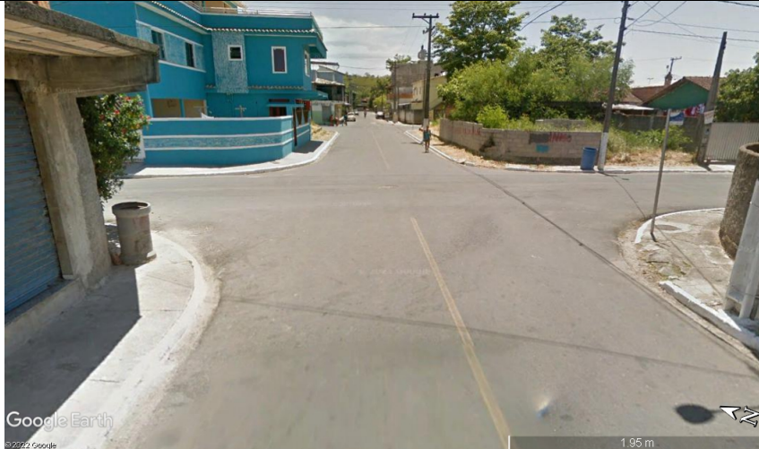
Imagem 6: Rua José Gomes Amado Sobrinho (coordenadas UTM 23k 788164.24 m E 7509681.80 m S).