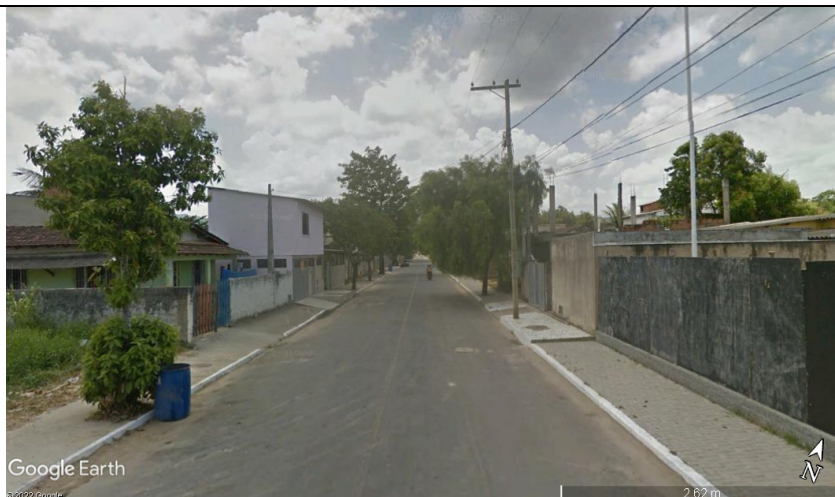
Imagem 5: Rua Maria José Marmelo dos Santos (UTM 23K 788233.62 m E 7509580.30 m S).