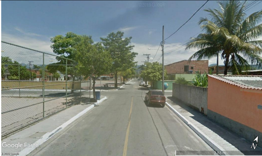
Imagem 3: Rua Silas Gaspar (coordenadas UTM 23k 788256.22 m E 7509681.08 m S).