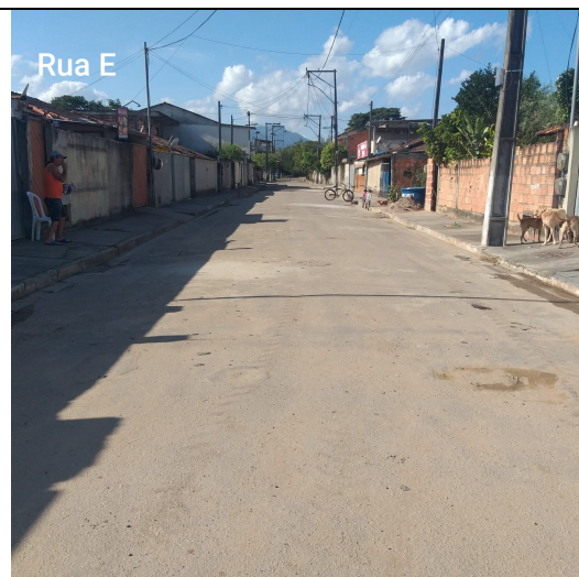
Imagem 17: Rua Dalva Macedo Estarnecks (coordenadas UTM 23 K 788273.84 m E 7508860.03 m S).