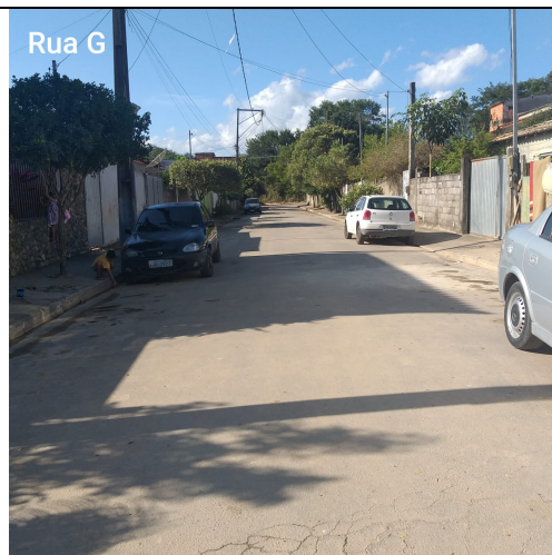
Imagem 19: João de Abreu (coordenadas UTM 23k 788315.04 m E 7508793.53 m S).