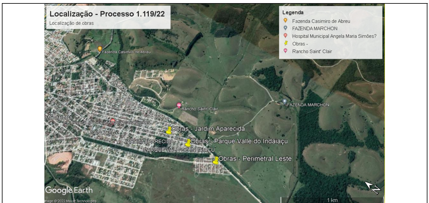
Imagem 1: Localização das intervenções, obtidas através do Programa Google Earth.