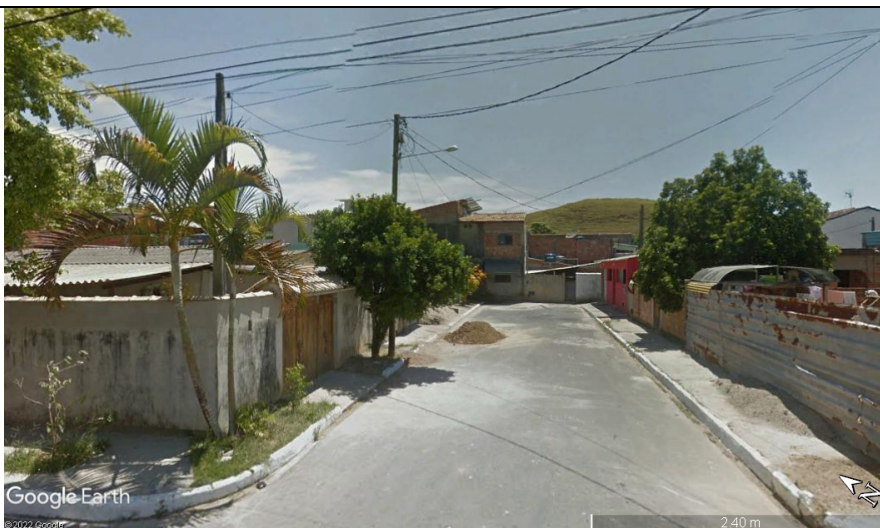
Imagem 11: Rua C - Jardim Aparecida (coordenadas UTM 23K 788346.95 m E 7509655.96 m S).