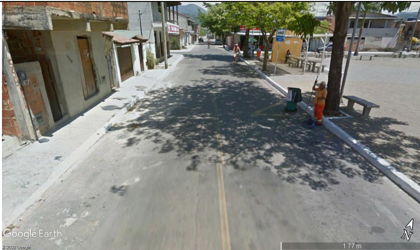
Imagem 4: Rua Tancredo Mendes Paixão (coordenadas UTM 23k 788222.94 m E 7509699.53 m S).