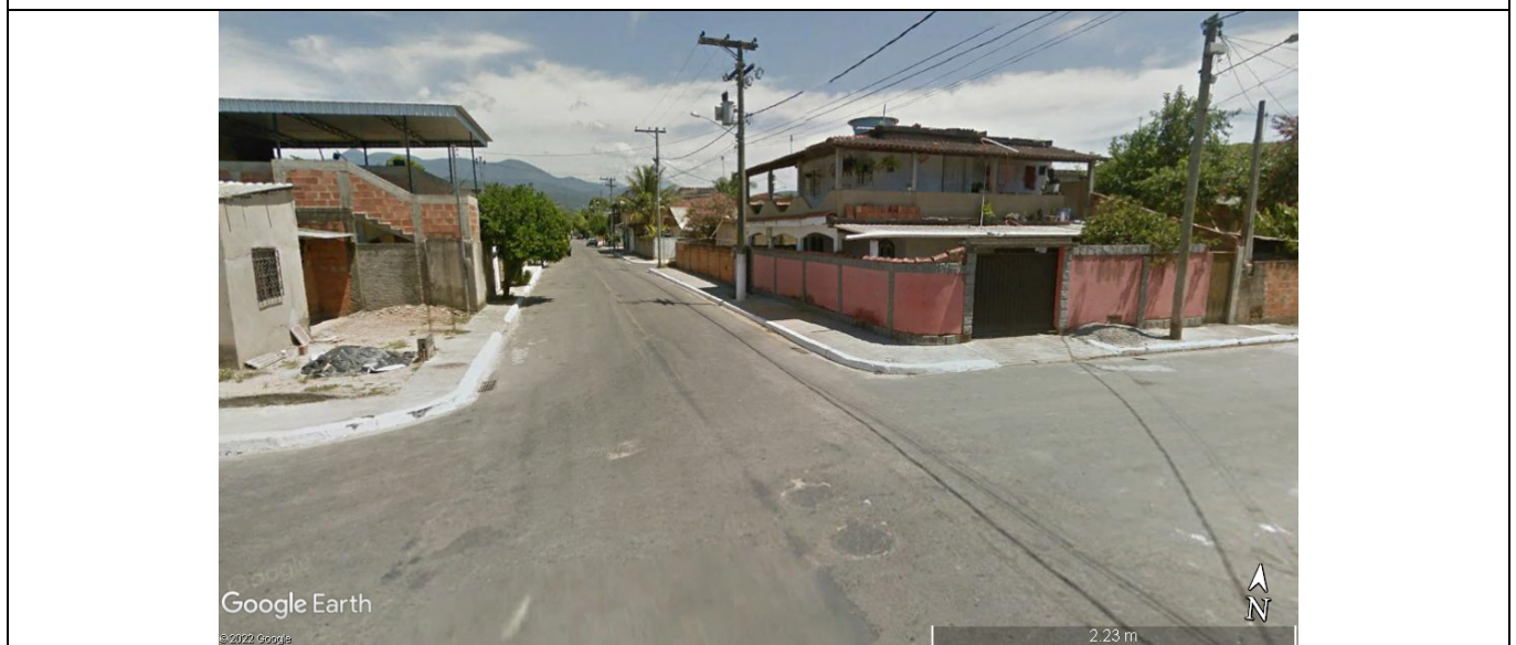
Imagem 2: Rua Genciano Riscado da Motta (coordenadas UTM 23K 788312.66 m E 7509683.52 m S).