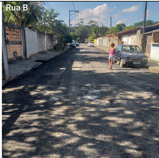
Imagem 14: Rua Paulina Jandre Pinto (coordenadas UTM 23k 788207.73 m E 7508961.69 m S).