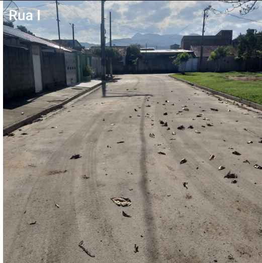
Imagem 21: Rua José Homero Fernandes Diniz (coordenadas UTM 23K 788336.86 m E 7508732.65 m S).