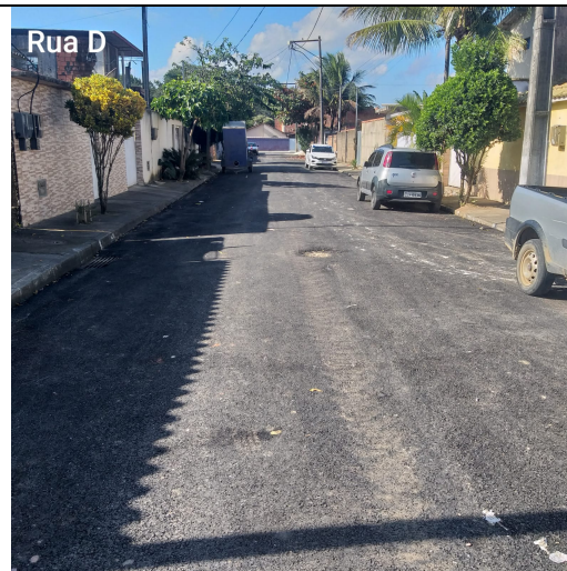
Imagem 16: Rua Diva Maria Lima Ribeiro (coordenadas UTM 23k 788252.47 m E 7508894.09 m S).