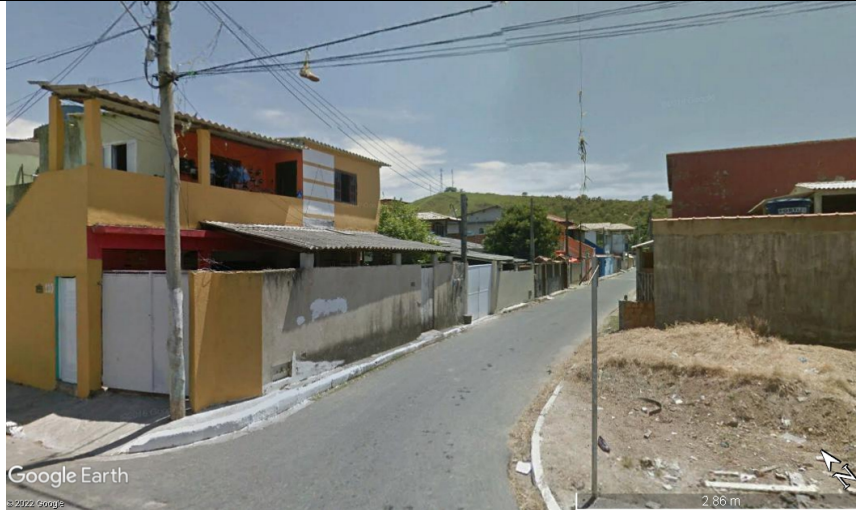
Imagem 9: Rua A - Jardim Aparecida (coordenadas UTM 23k 788283.48 m E 7509803.70 m S).