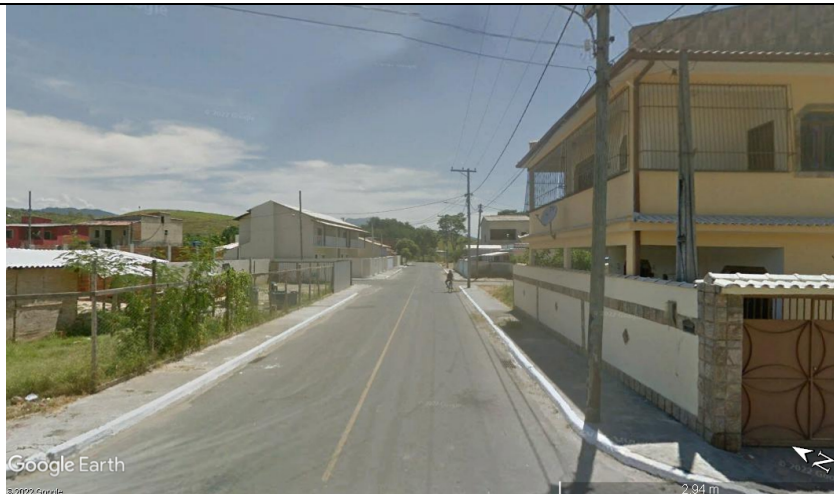
Imagem 8: Rua A - Parque Valle do Indaiáçu (coordenadas UTM 23k 788431.25 m E 7509447.11 m S).