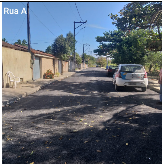
Imagem 13: Rua Ricardo Rodrigues Ataíde Filho (coordenadas UTM 23k 788183.80 m E 7508990.65 m S).