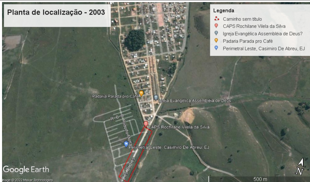
Imagem obtida através do Programa Google Earth da série histórica no ano de 2003.

Mediante tais circunstâncias e constatações, verificamos a existência de justificativa legal e viabilidade para concessão de uso da Faixa Marginal de Proteção em questão, tendo em vista que tais intervenções podem ser consideradas como de baixo impacto, de acordo com a Lei nº 12.651/2012, que nos seus artigos 3º, alínea “b”, do inciso X e 8º.