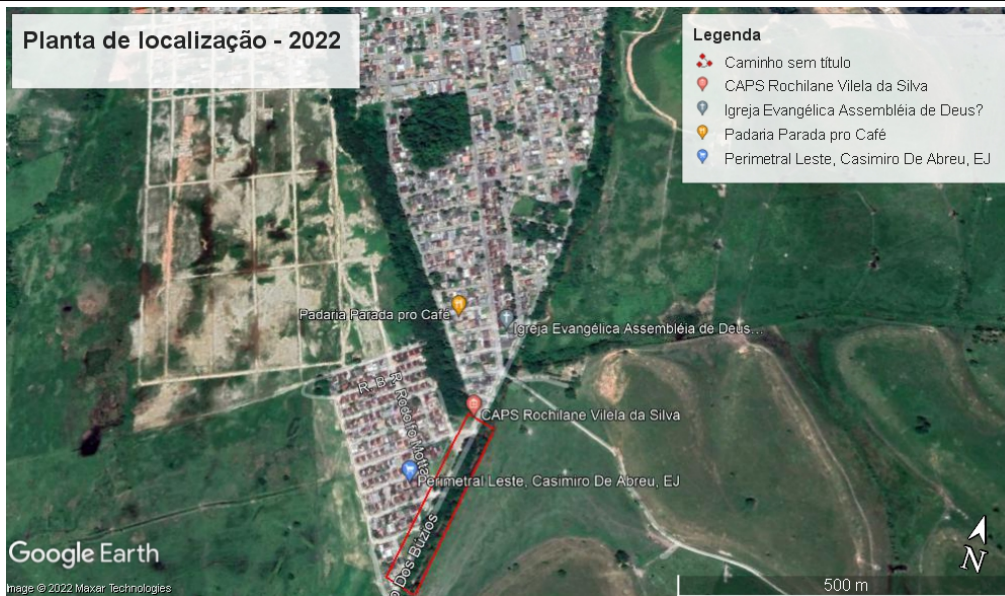
Imagem obtida através do Programa Google Earth da série histórica no ano de 2022.