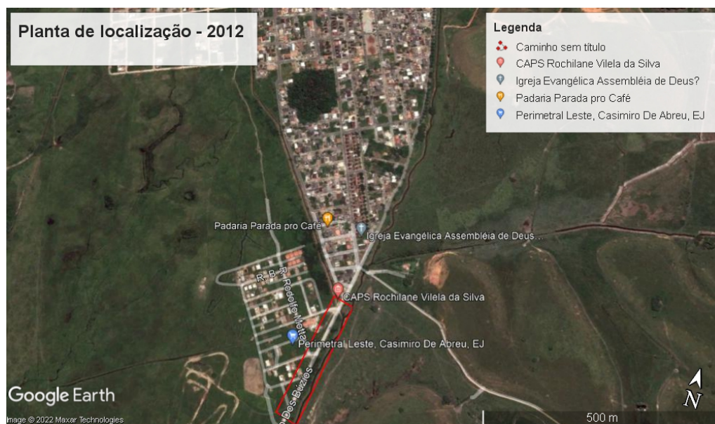
Imagem obtida através do Programa Google Earth da série histórica no ano de 2012.

Imagem obtida através do Programa Google Earth da série histórica no ano de 2022.