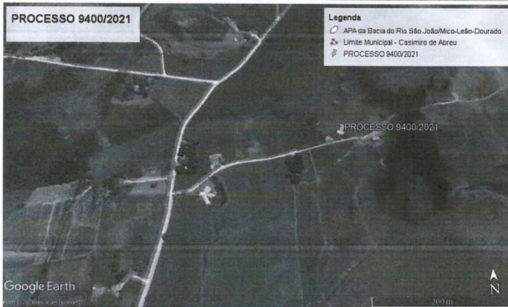
FIGURA 1: Localização do empreendimento obtida através do Programa Google Earth.