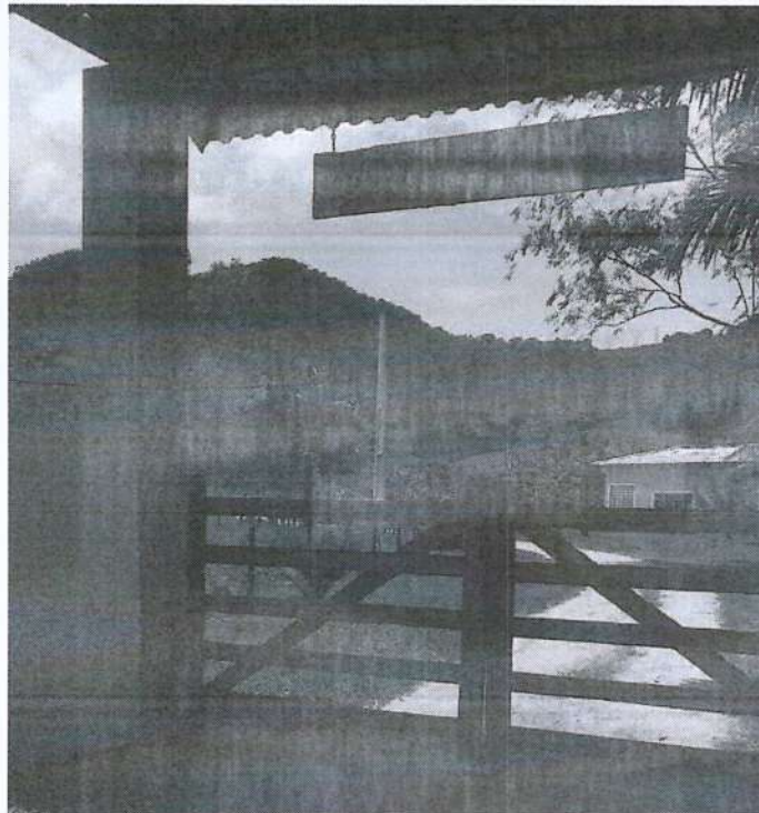
FIGURA 02: Entrada da propriedade