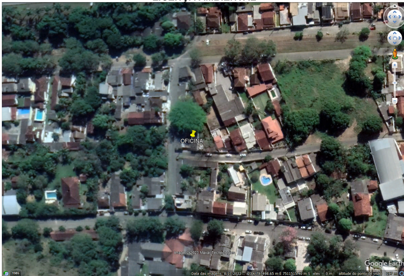
FIGURA 1: Localização do empreendimento, imagem obtida pelo Programa Google Earth .

A seguir é apresentado o registro fotográfico da vistoria realizada.