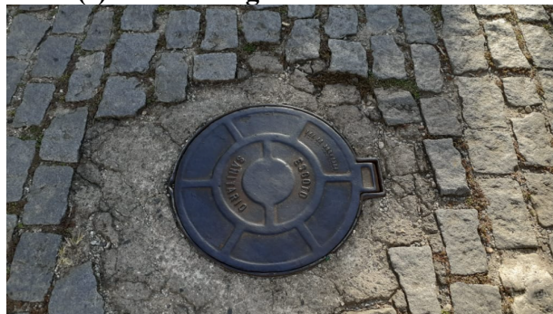
FIGURA 2: Registro fotográfico da vistoria.