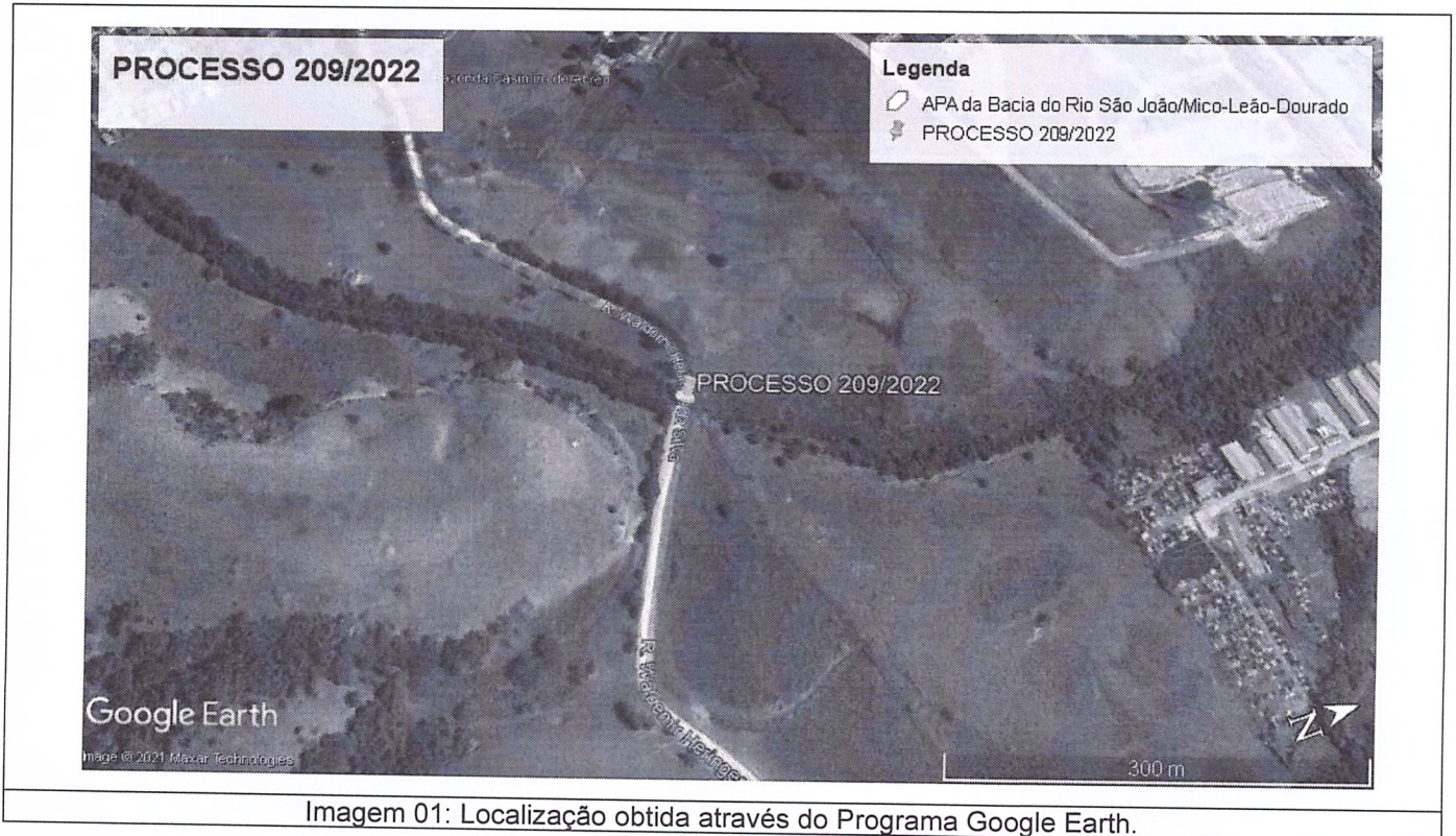
Imagem 01: Localização obtida através do Programa Google Earth.