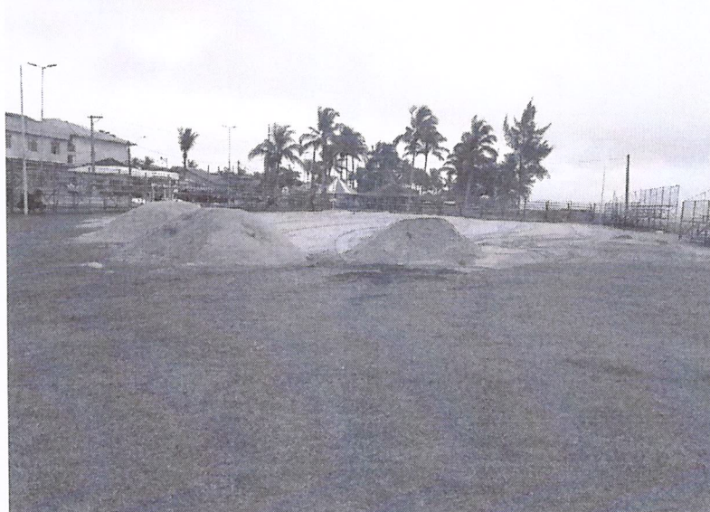
Imagem 06: Ponto 02, local de despejo próximo ao quiosque Rota 101.

Trata-se de intermediações em áreas pertencentes a faixa de areia que compõe a Linha Preamar, conhecida como Praião, ao longo da Avenida Marcílio Dias, onde serão permutados pequenos volumes, de locais próximos e componentes da mesma estrutura mineral, com ausência de quaisquer tipos de vegetações ou fauna residente, com o objetivo de nivelamento de solo de porções lá existentes, onde se situam áreas de lazer/ quadras esportivas constituintes daquela Orla Marítima consolidada.