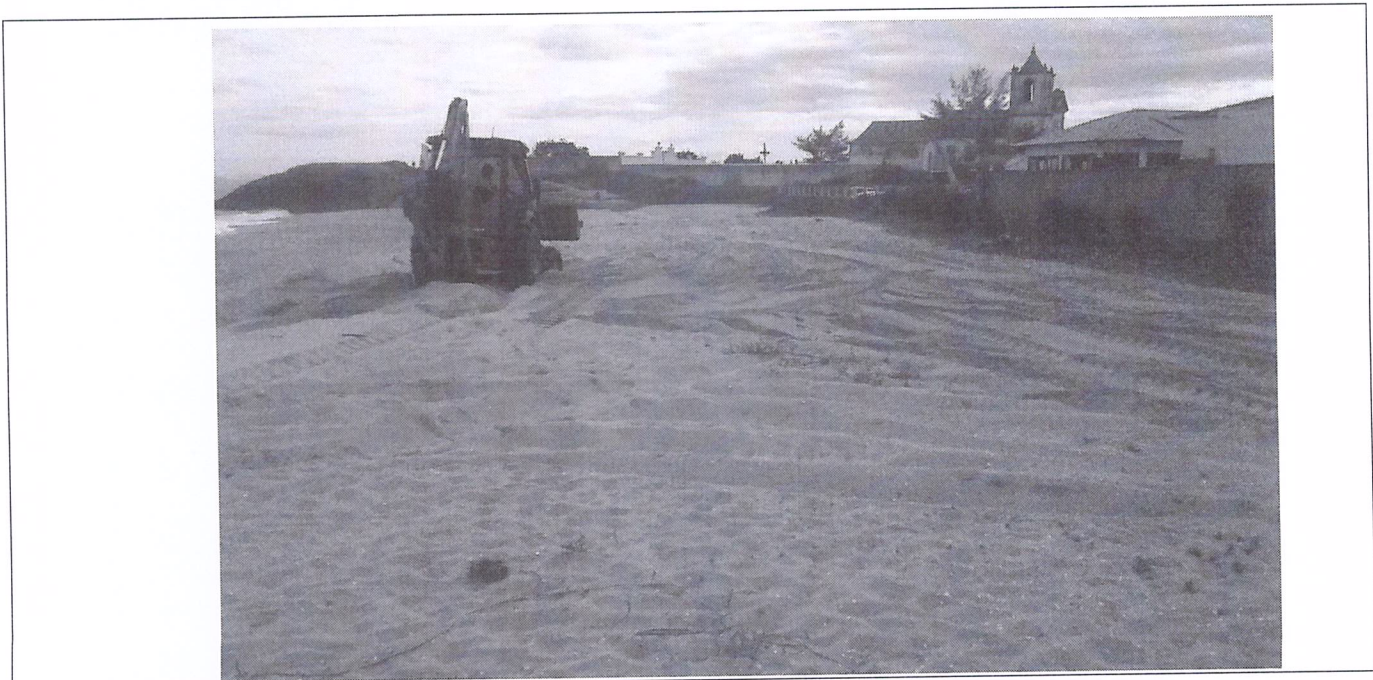
Imagem 02: Área de Empréstimo