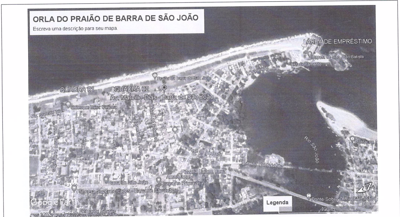
Imagem 1: Localização das intervenções, obtidas através do Programa Google Earth, indicando as Coordenadas Geográficas : Área de empréstimo próxima a prainha - 22°35'52.16" S 41°59'22.99" O // Quadra 01 - 22°35'17.44" S 41°59'16.46" O / Quadra 02 - 22°35'22.21" S 41°59'17.98" O