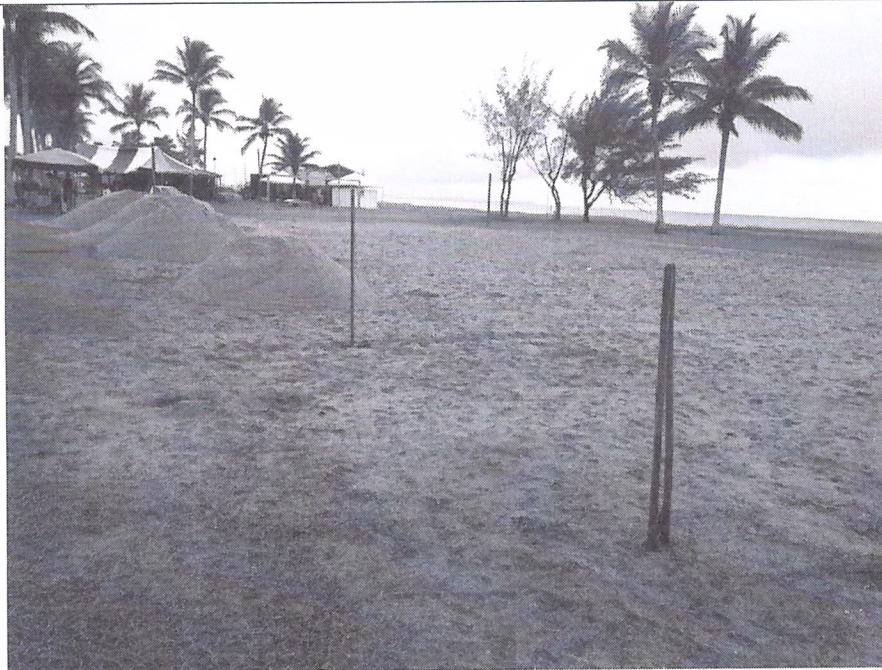
Imagem 05: Ponto 01, local de despejo próximo ao quiosque do Jailton.