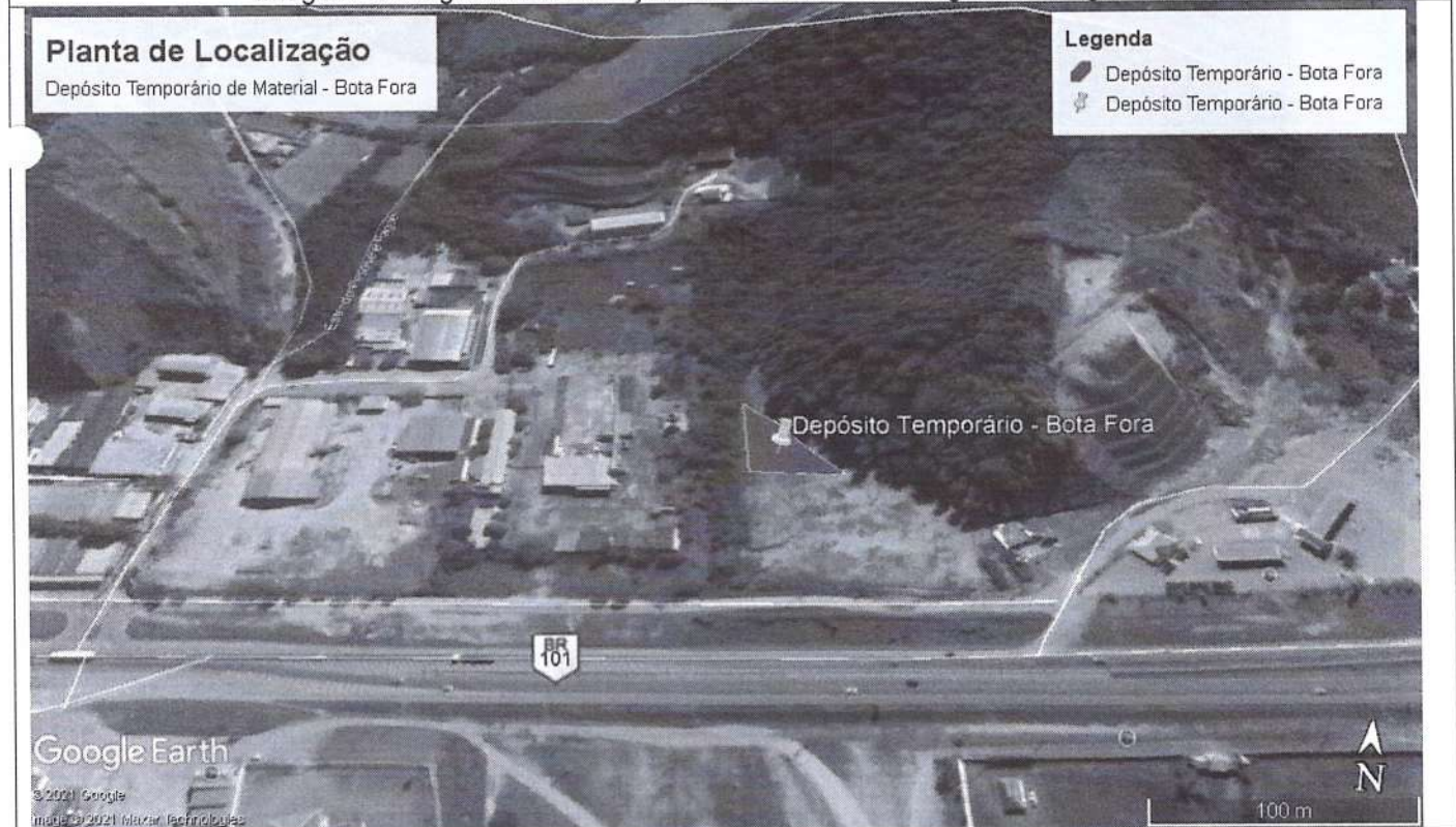
Imagem 2: Localização do local a ser utilizado como Depósito de Material Temporário.