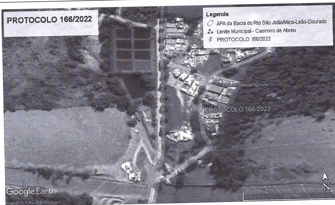
Imagem 01: Localização obtida através do Google Earth.