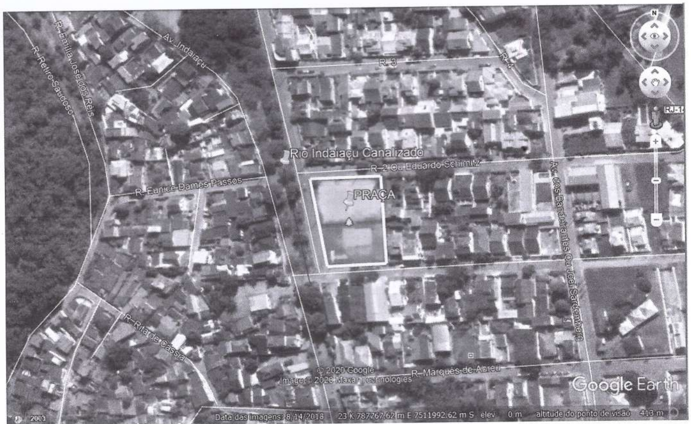
FIGURA 1: Localização da área em relação ao corpo hídrico.