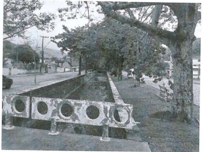
FIGURA 2: Fotos da Vistoria.

Trata-se de corpo hídrico natural, que teve sua margem canalizada. Existindo a jusante uma barragem que controla o fluxo da área de captação do Indaiáçu. A área a ser feita a praça localiza-se a menos de 30 metros do corpo hídrico. Observou-se ser inviável a reabilitação Ambiental da APP.