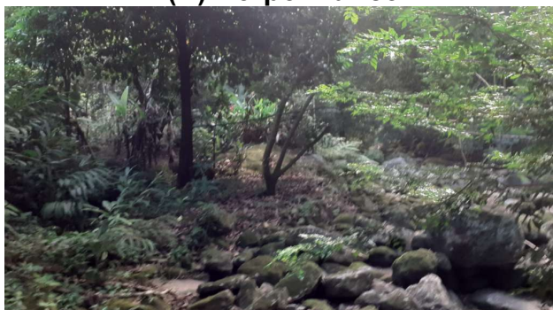
FIGURA 2: Registro fotográfico da vistoria realizada