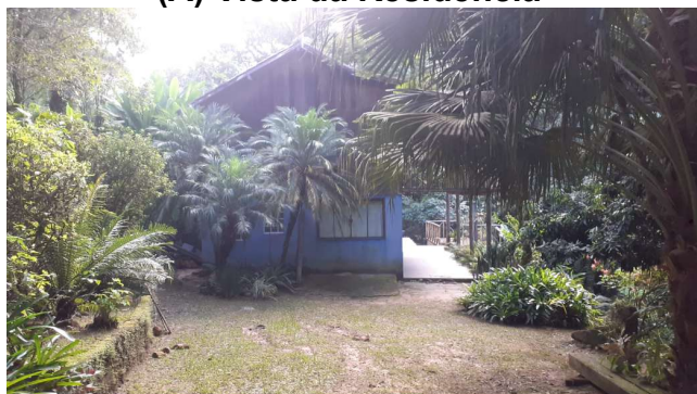
(A) Vista da Residência