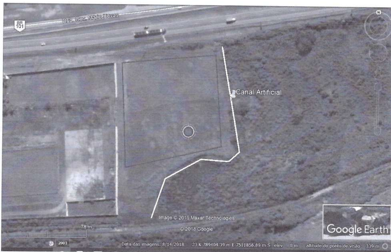
FIGURA 3: Localização do local destinado ao DTM antes da utilização.