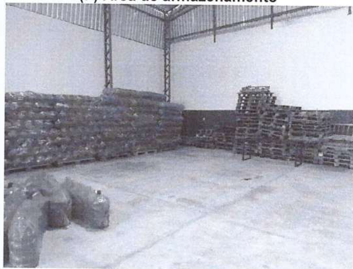
FIGURA 2: Registro da Vistoria.

Casimiro de Abreu, 23 de dezembro de 2020.