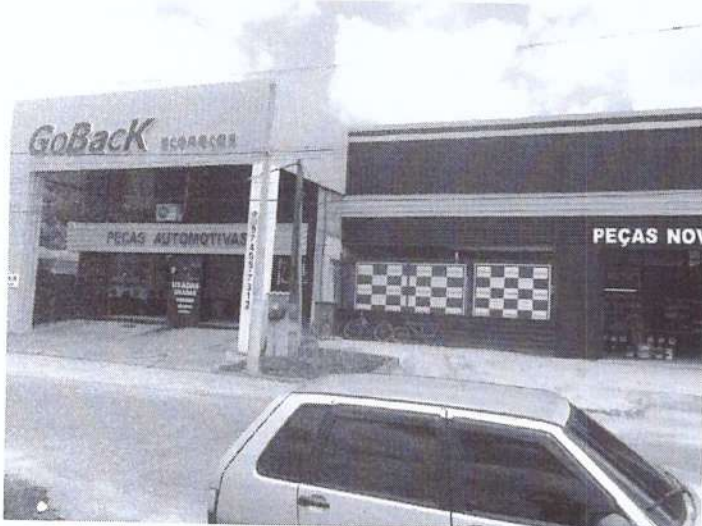
b) Vista da fachada.