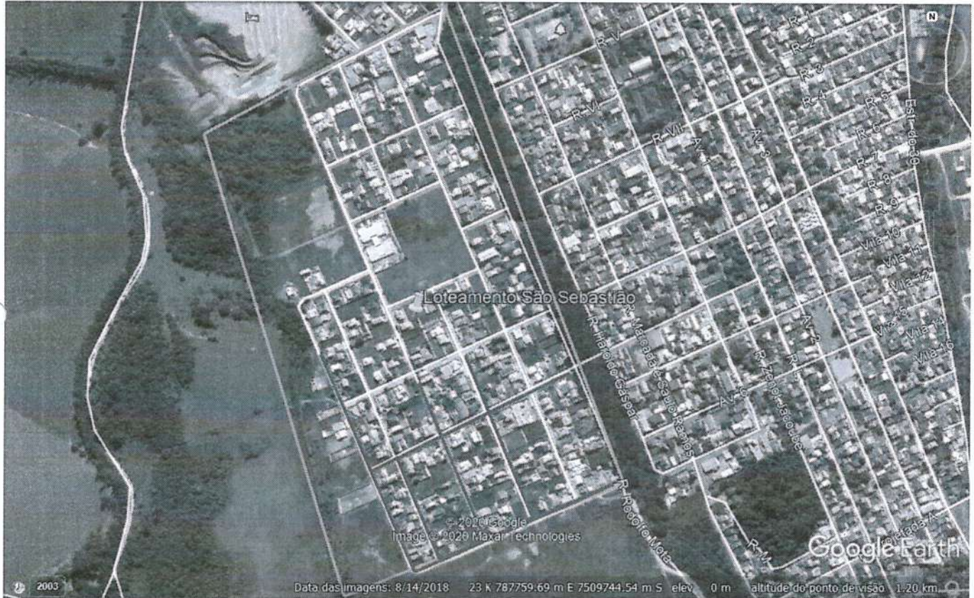
FIGURA 1: Delimitação da área do loteamento e vias não pavimentadas.