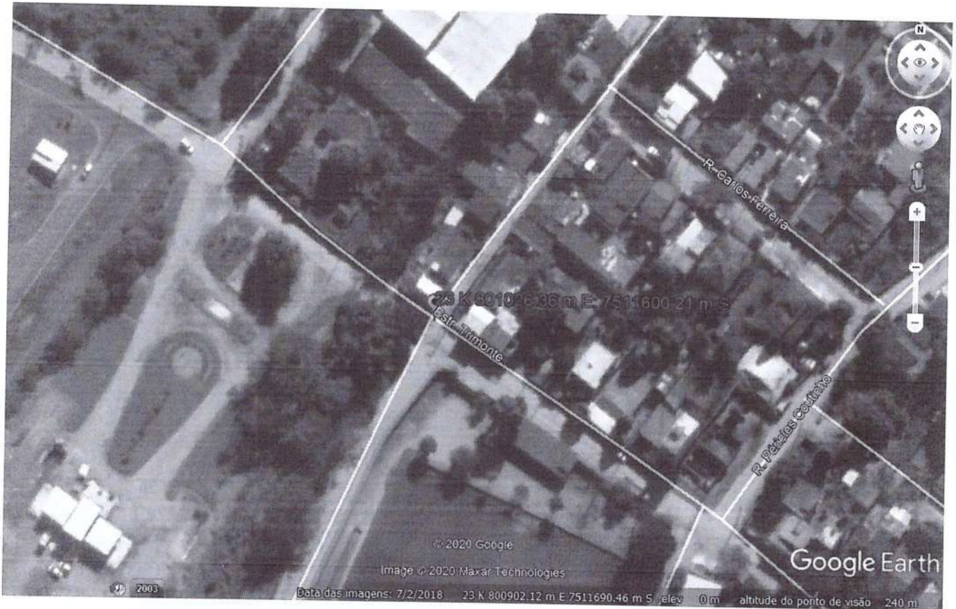
FIGURA 1: Localização da Intervenção.