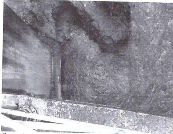
FIGURA 2: Registro fotográfico da Vistoria.