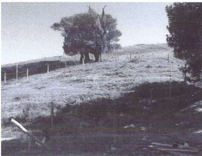
a) Vista da área de intervenção.