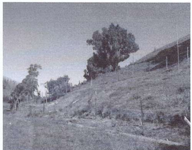
b) área de depósito de excedente de material.