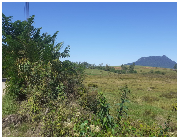
(B) Vista da área que receberá a extensão de rede