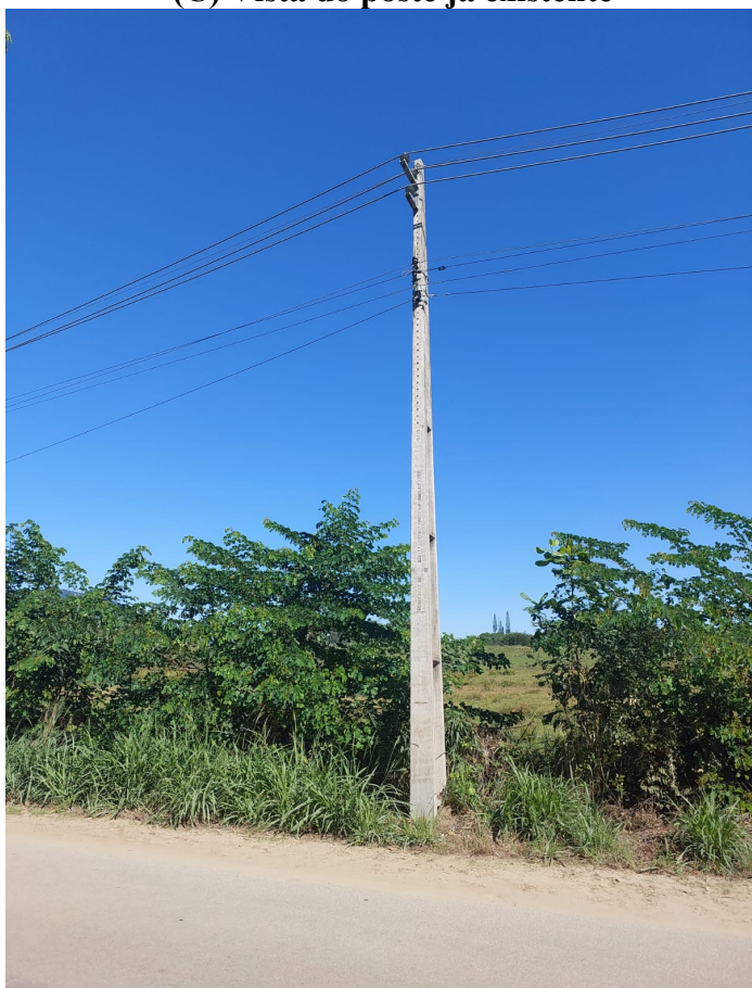
(C) Vista do poste já existente