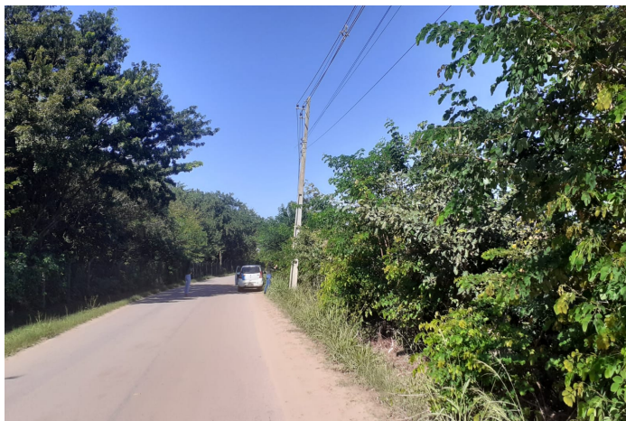
(A) Vista do ponto inicial da intervenção