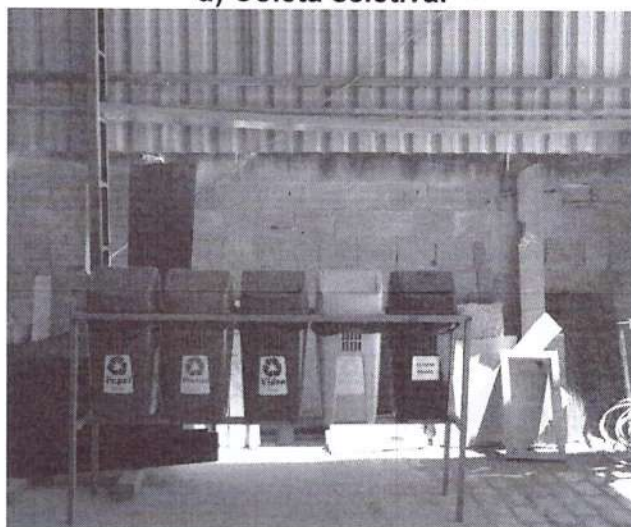
d) Coleta seletiva.