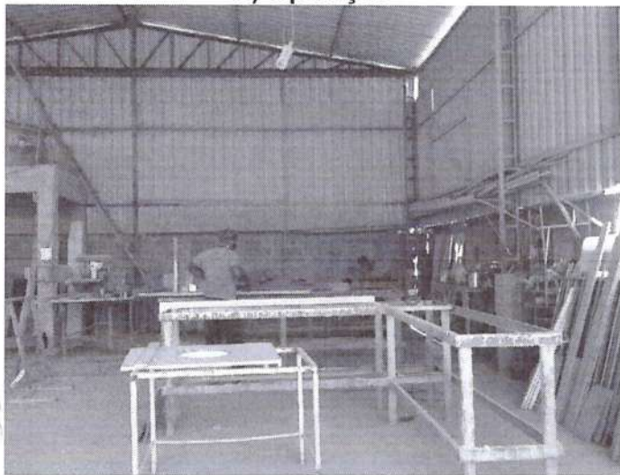
FIGURA 2: Registro da Vistoria.