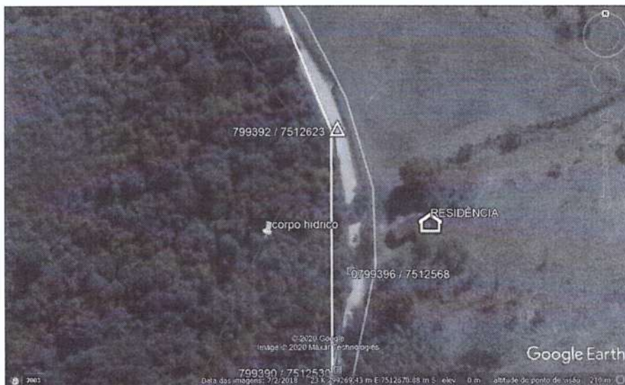
Figura 3: Vista aérea da área a ser Implantada a rede de energia em relação ao corpo hídrico.