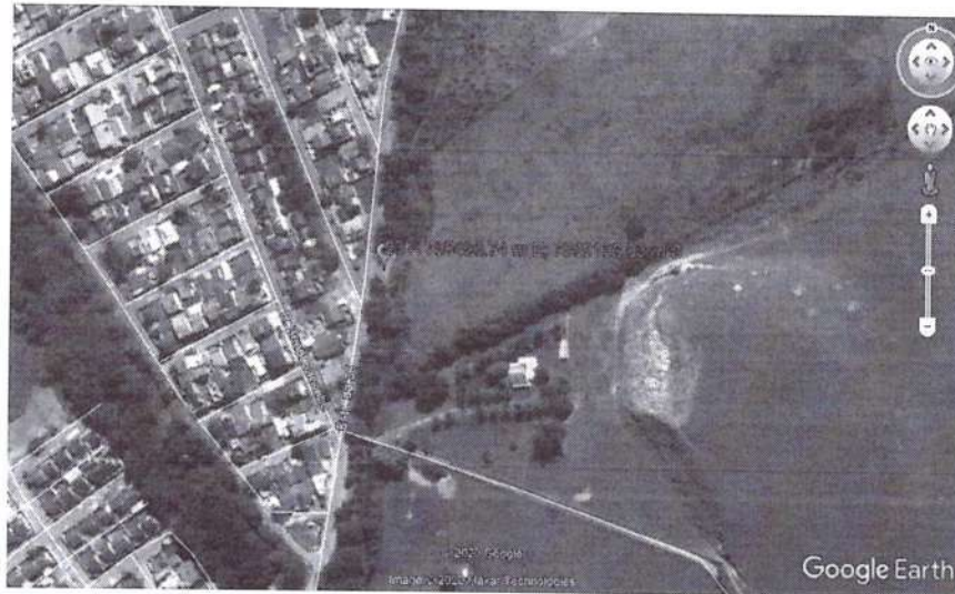
FIGURA 1: Localização da Intervenção.