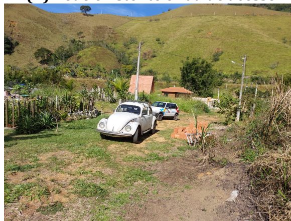
FIGURA 02: Registro da Vistoria.