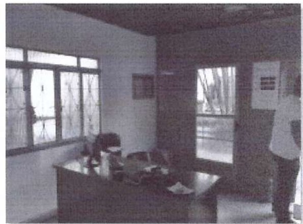
b) Área de recepção