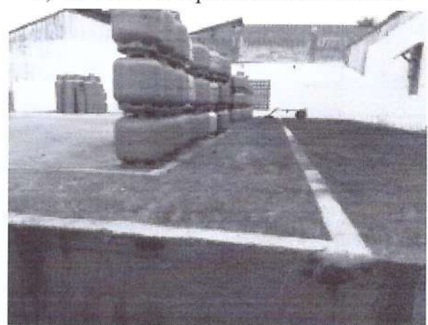
f) Sinalização de Pátio.