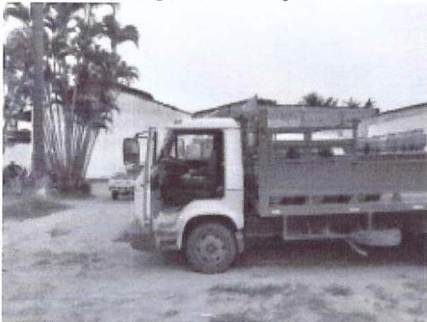
e) Veículo de entrega