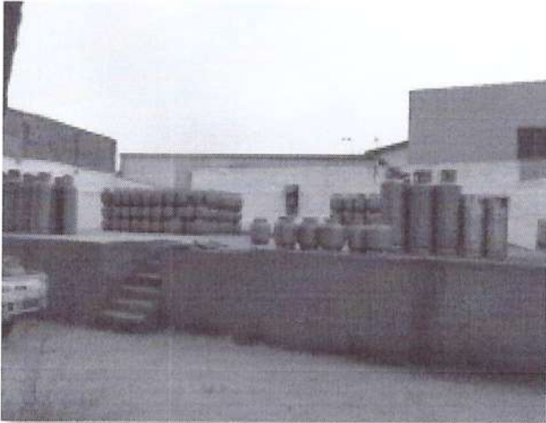
c) Depósito de bujões.