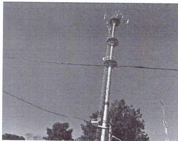
b) Detalhe da parte superior