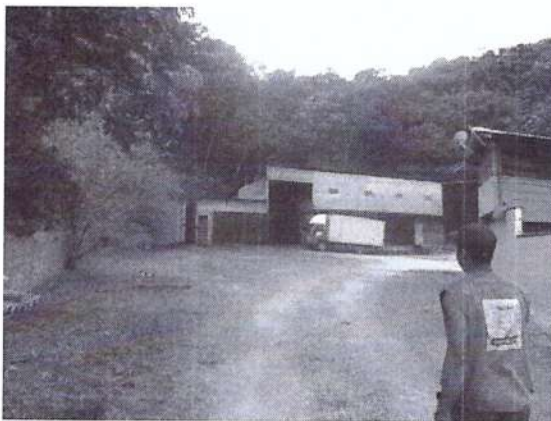
Vista do galpão de operação da atividade.