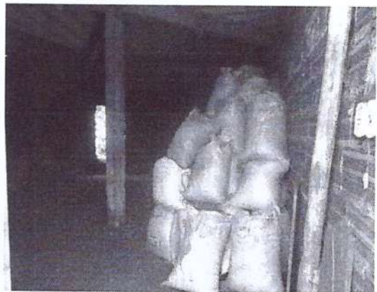
Área de depósito de material rejeitado de baixa granulometria.