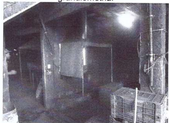
Local de empacotamento