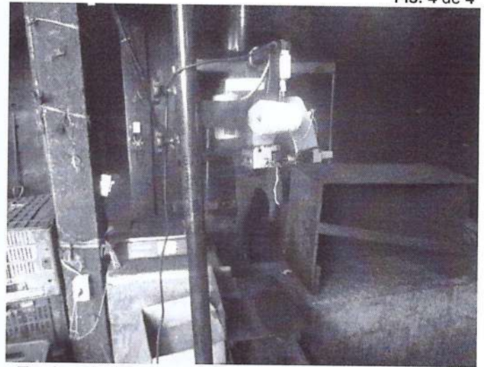
Equipamento para fechamento de embalagem e balança.