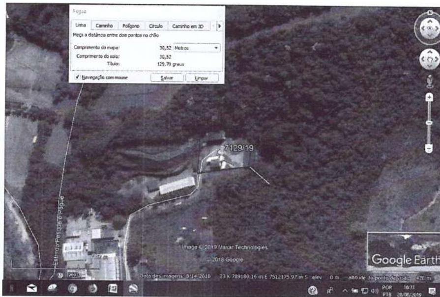
Registro da Vistoria: