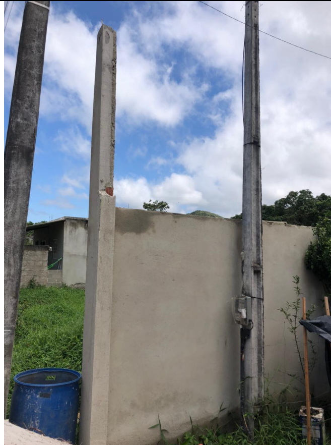
Imagem 03: Poste padrão de energia