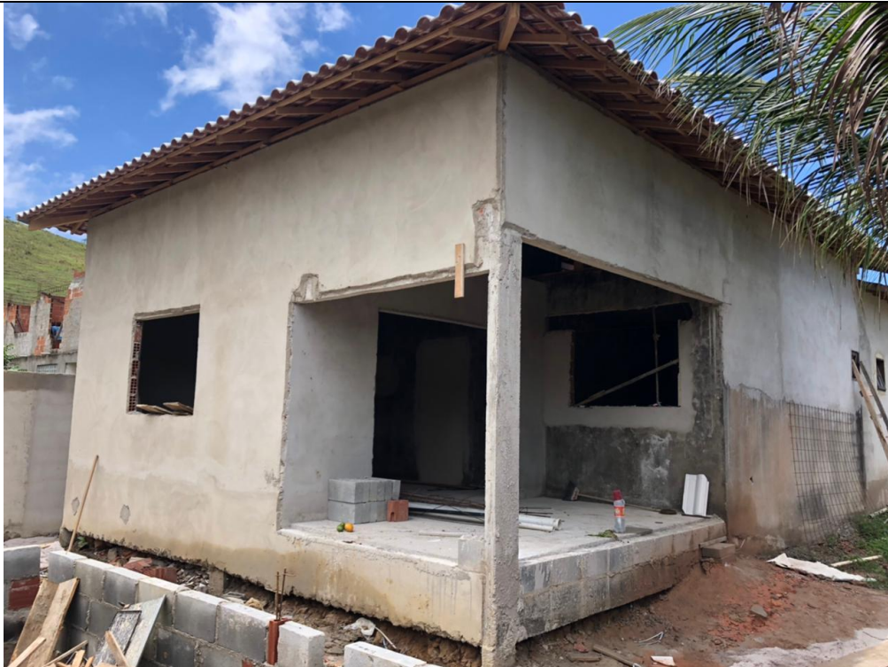
Imagem 02: Vista da propriedade