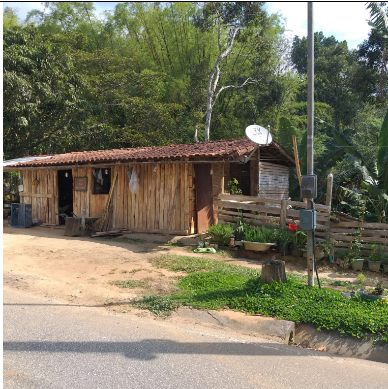
Imagem 02: Vista da propriedade