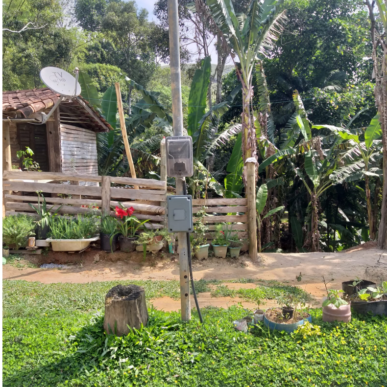
Imagem 03: Poste padrão de energia