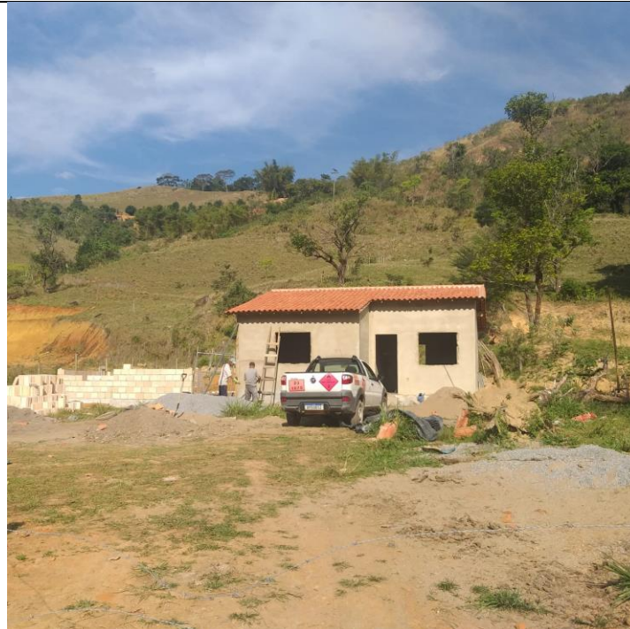
Imagem 02: Vista da propriedade