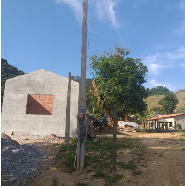
Imagem 03: Poste padrão de energia