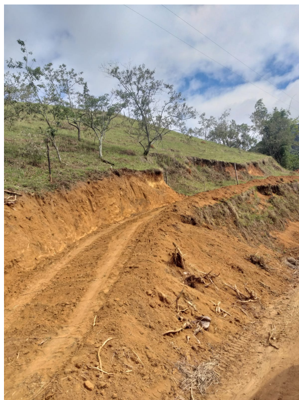
Imagem 02: Entrada da propriedade.