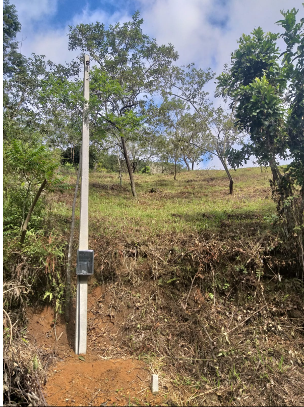
Imagem 03: Poste padrão de energia.