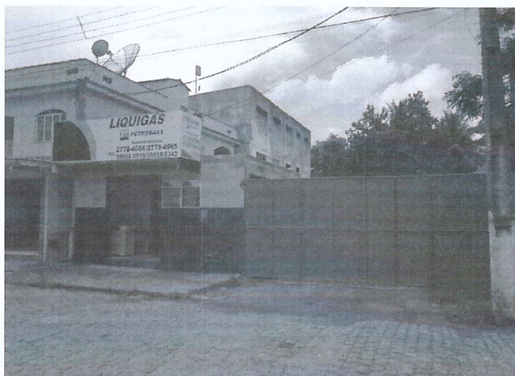
Figura 2: Fachada do estabelecimento.