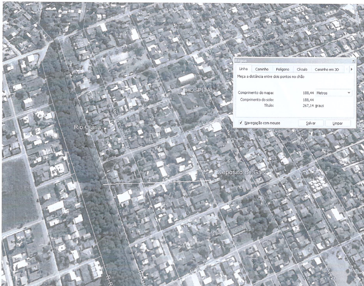
Figura 1: Localização do depósito de gás vistoriado. Detalhe do distanciamento de corpo hídrico.