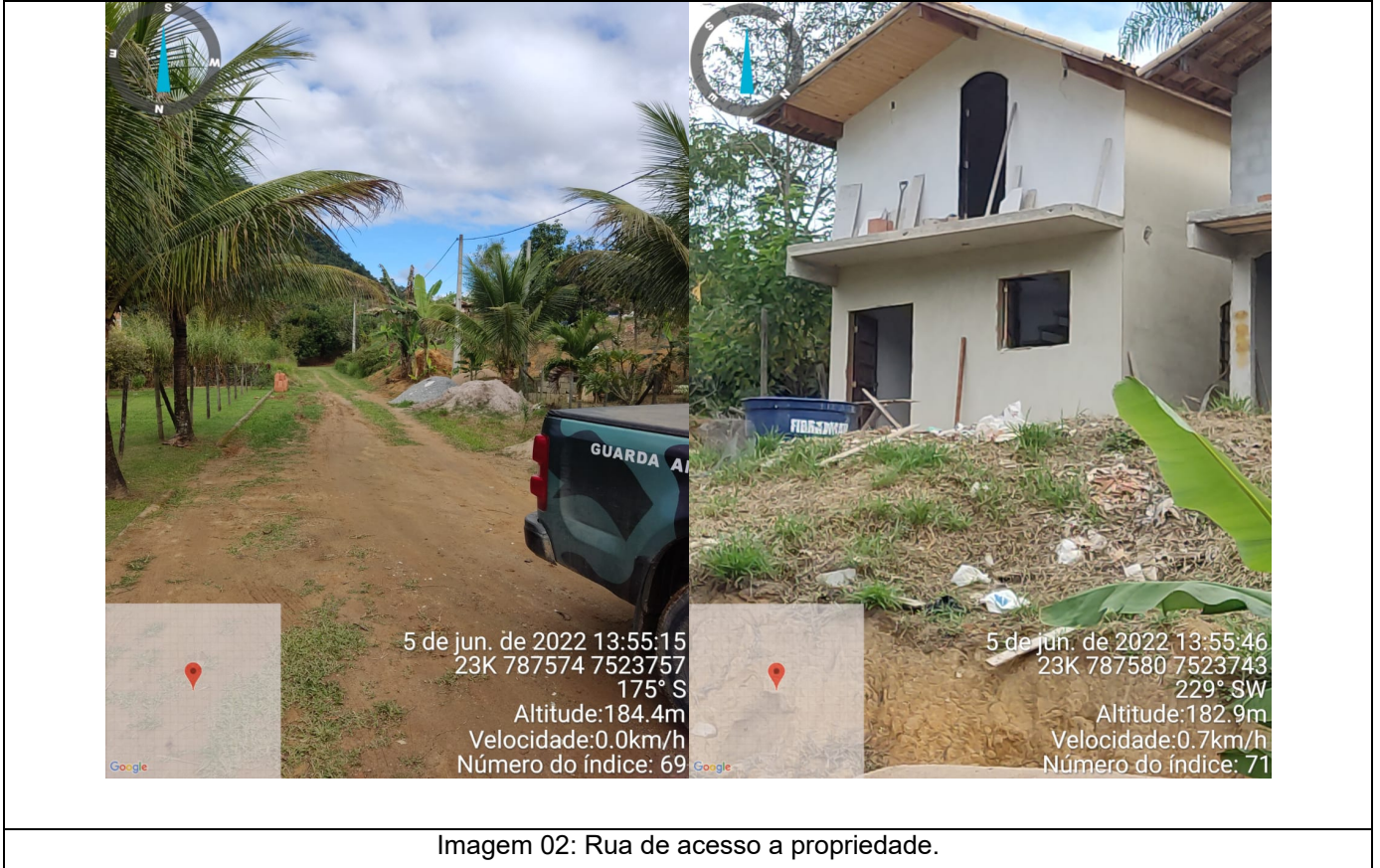
Imagem 02: Rua de acesso a propriedade.