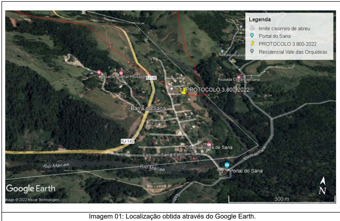
Imagem 01: Localização obtida através do Google Earth.