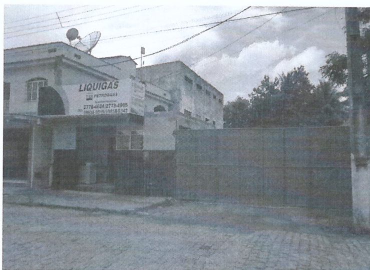
Figura 2: Fachada do estabelecimento.