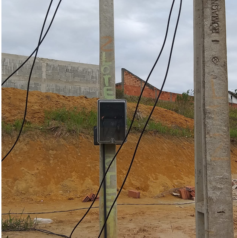
Imagem 03: Poste padrão de energia