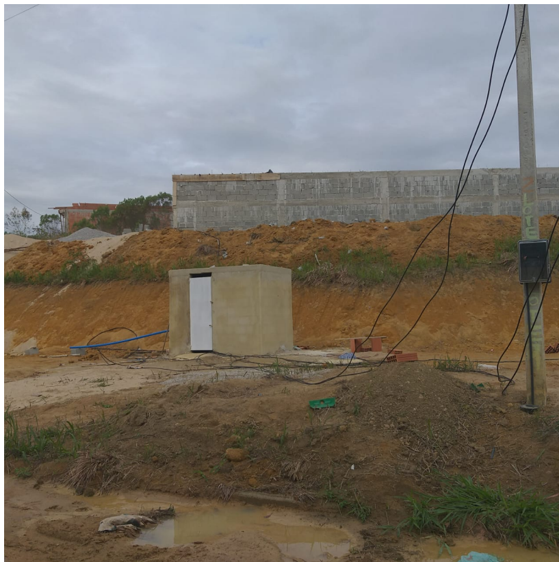
Imagem 02: Vista da propriedade