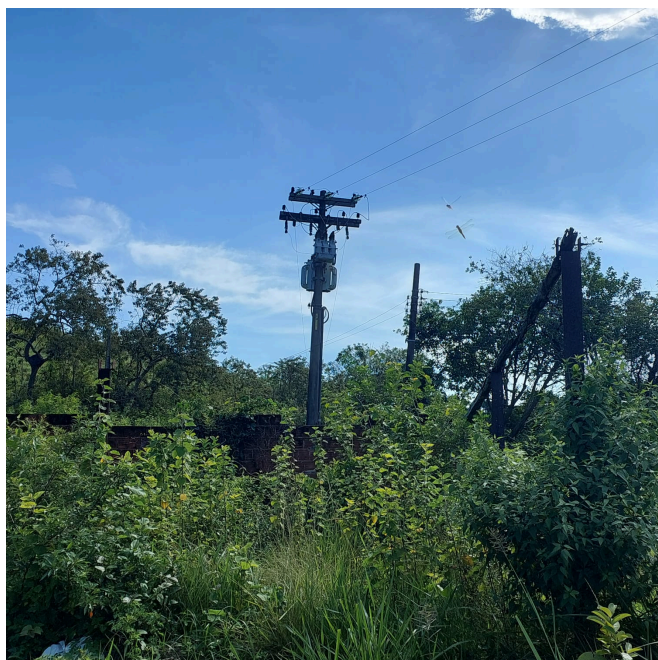
Figura 4: Transformador antigo citado no processo.