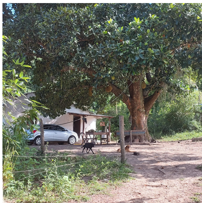
Figura 3: Segunda casa a ser abastecida pela Enel.