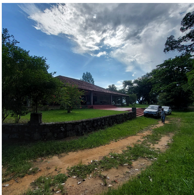
Figura 2: Primeira casa (sede) a ser abastecida pela Enel.