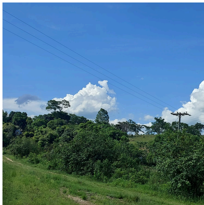
Figura 5: Extensão de rede que leva energia baixa para as casas.

Trata-se de local com características rurais, e rede elétrica já existente. Foi observado que as residências não estão localizadas em Área de Preservação Permanente (Lei 12651/2012), sendo portanto - quanto aos aspectos ambientais - apta ao fornecimento de energia elétrica.