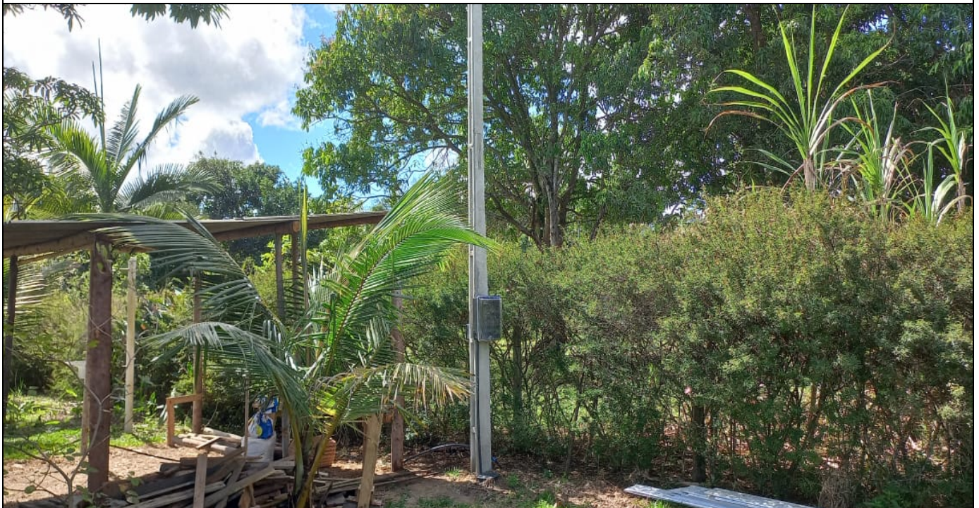
Imagem 02: Vista da propriedade.