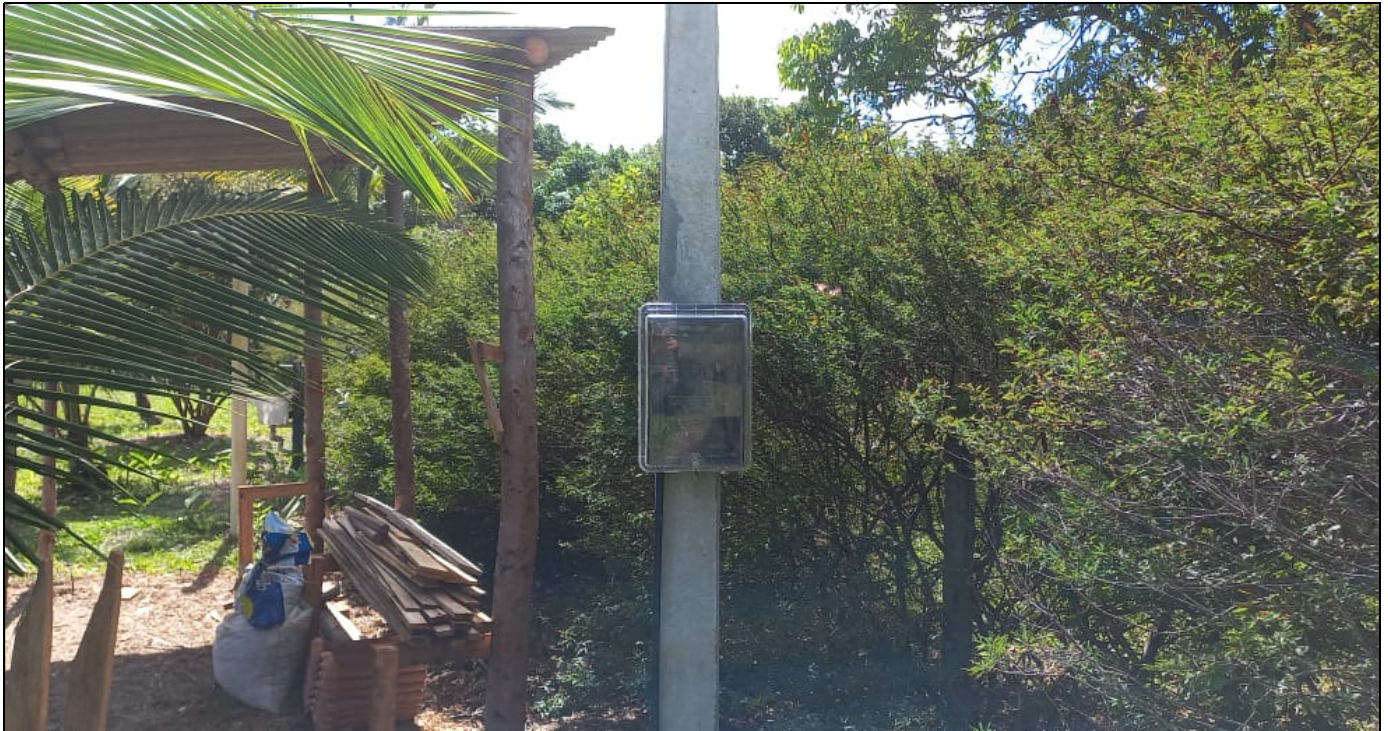
Imagem 3: Vista do Poste Padrão