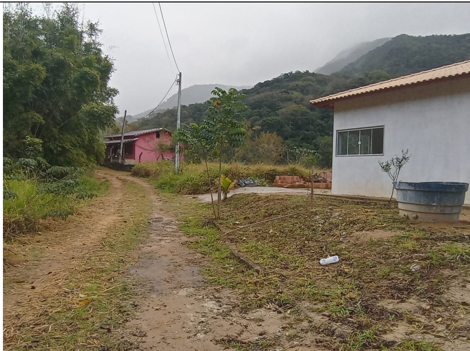
Imagem 4: Vista da estrada que dá acesso à propriedade.