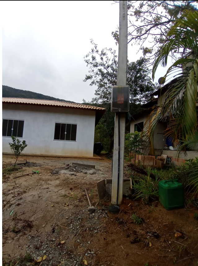
Imagem 3: Vista do Poste Padrão