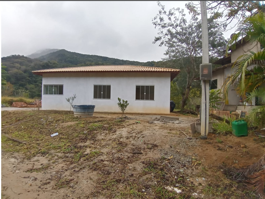
Imagem 02: Vista da propriedade.