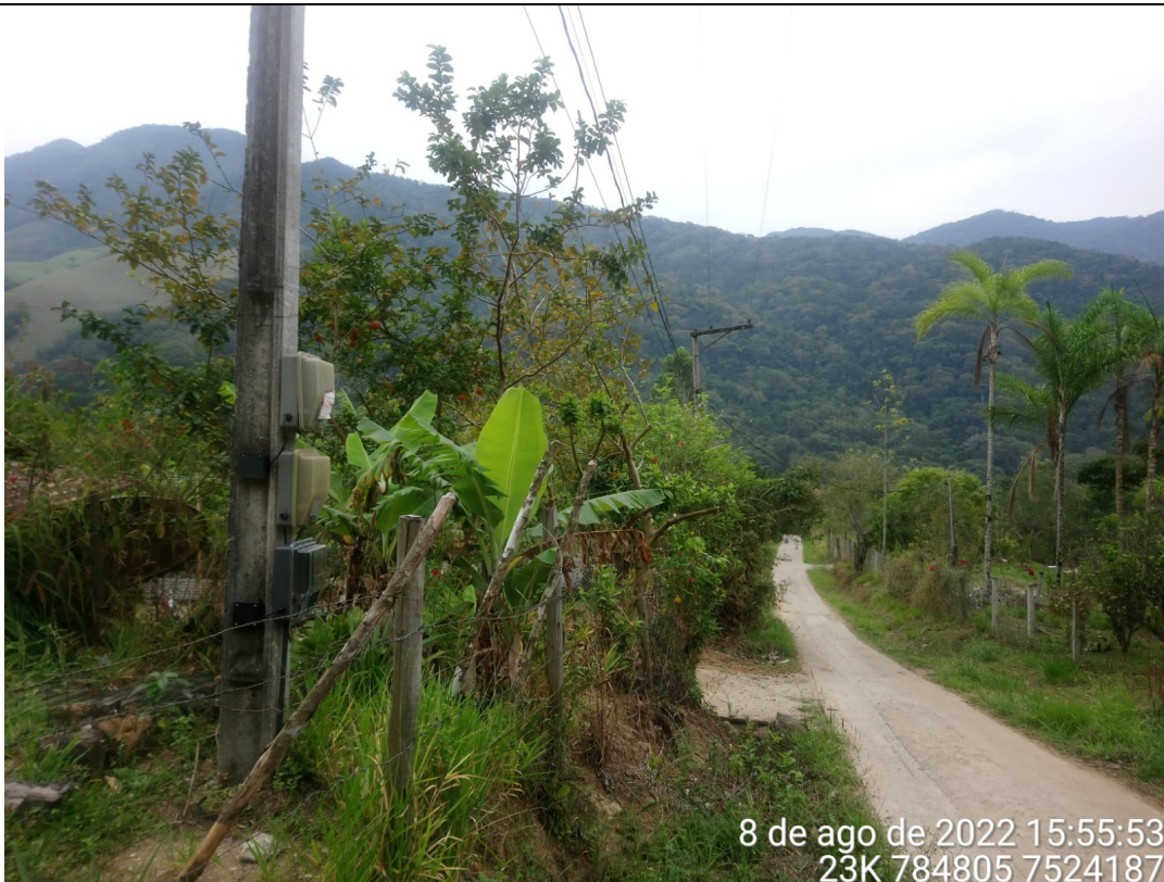
Imagem 4: Vista da estrada que da acesso a propriedade.