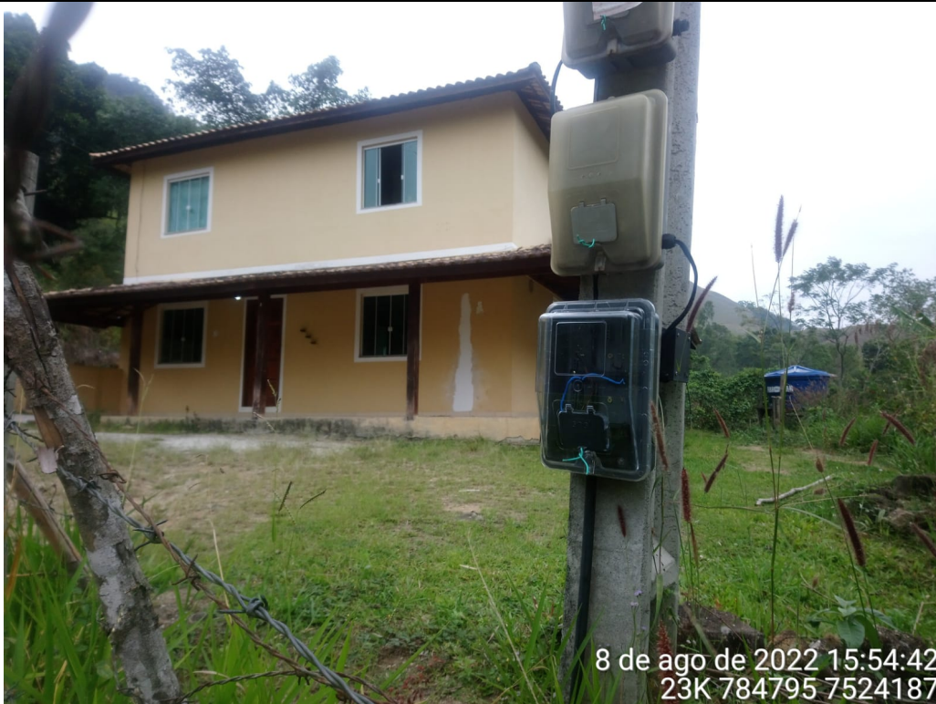
Imagem 3: Vista do Poste Padrão