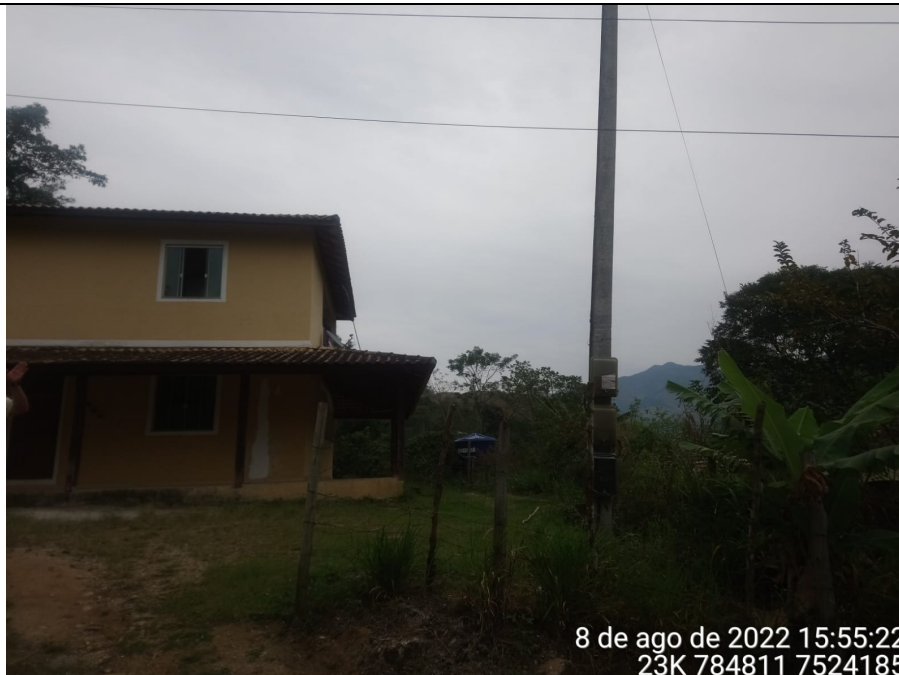
Imagem 02: Vista da propriedade.