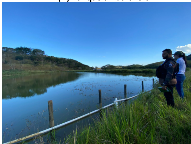
(D) Tanque ainda cheio