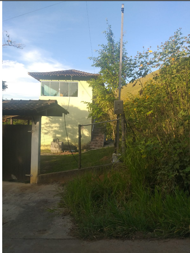
Imagem 04: Poste padrão de energia.