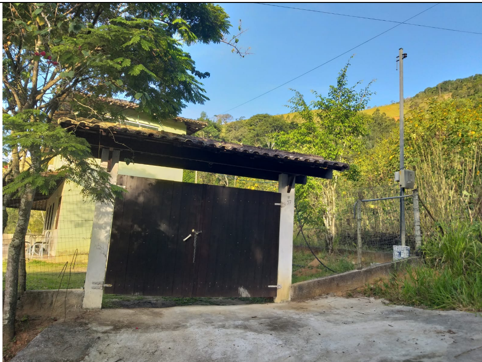
Imagem 02: Entrada da propriedade.