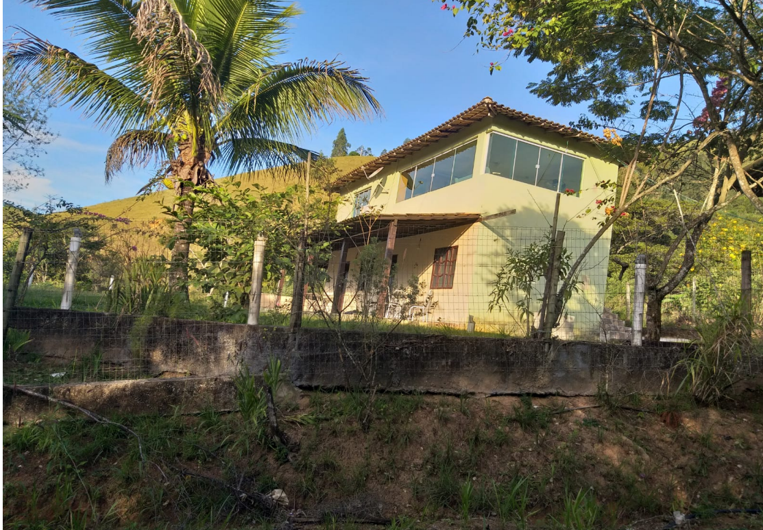
Imagem 3: Vista da propriedade.