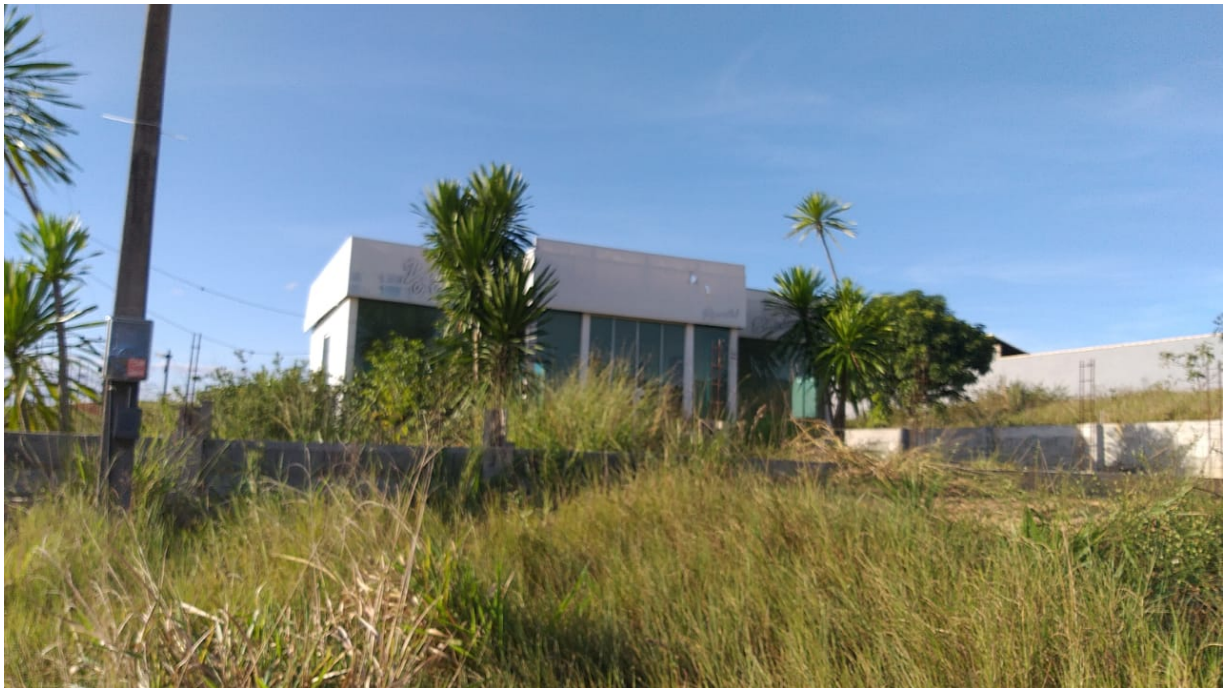
Imagem 02: Entrada da propriedade