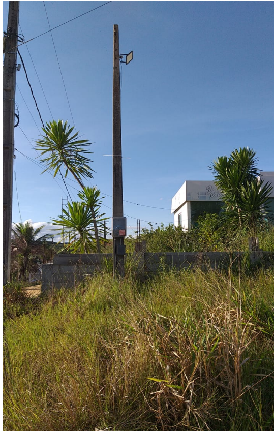
Imagem 03: Poste padrão de energia