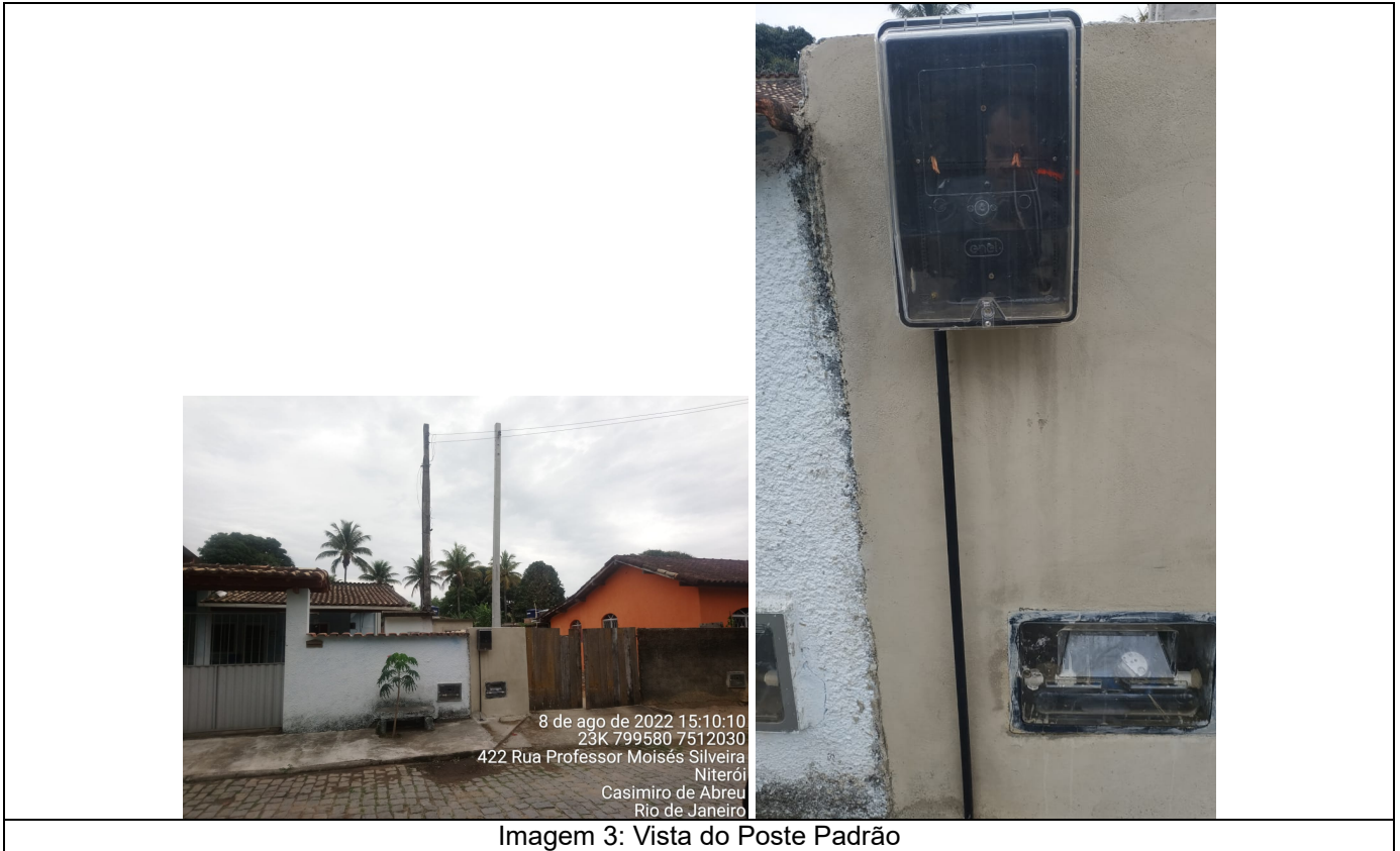
Imagem 3: Vista do Poste Padrão