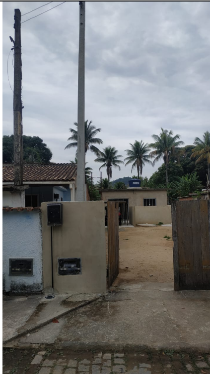
Imagem 02: Vista da propriedade.