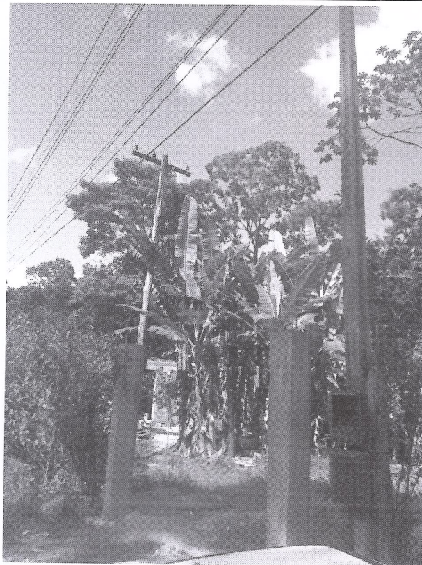
Imagem 02: Poste padrão de energia elétrica e caixa de distribuição.