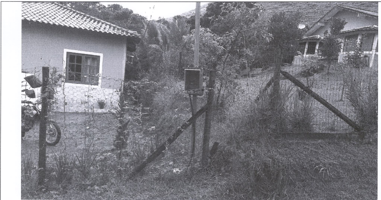
Imagem 02: Poste padrão de energia