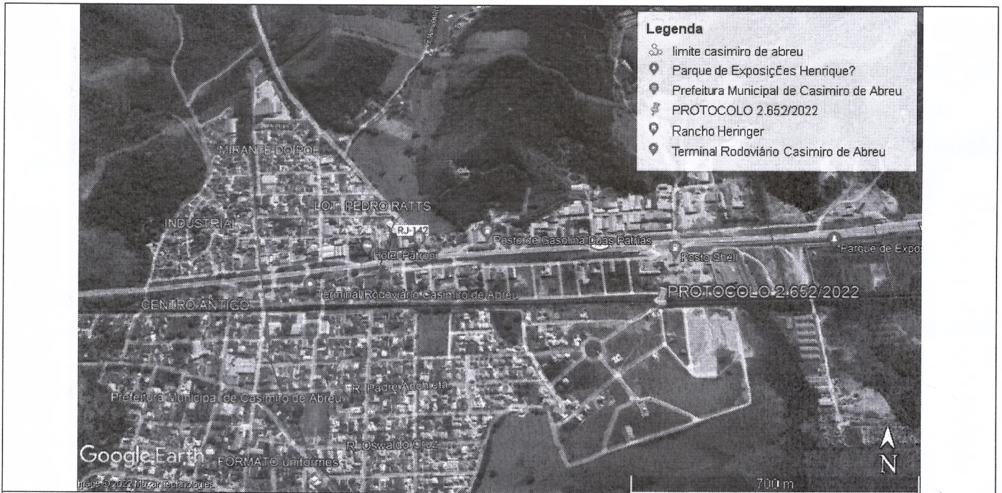
Imagem 01: Localização obtida através do Google Earth.