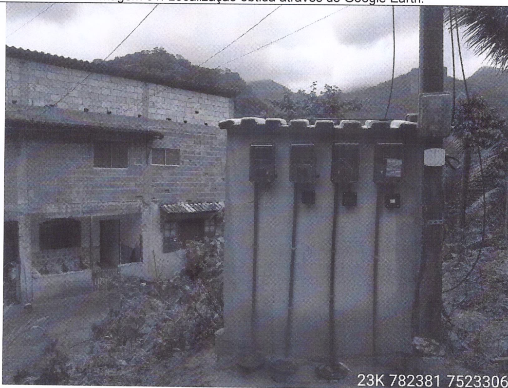
Imagem 02: Poste padrão de energia elétrica e caixa de distribuição.