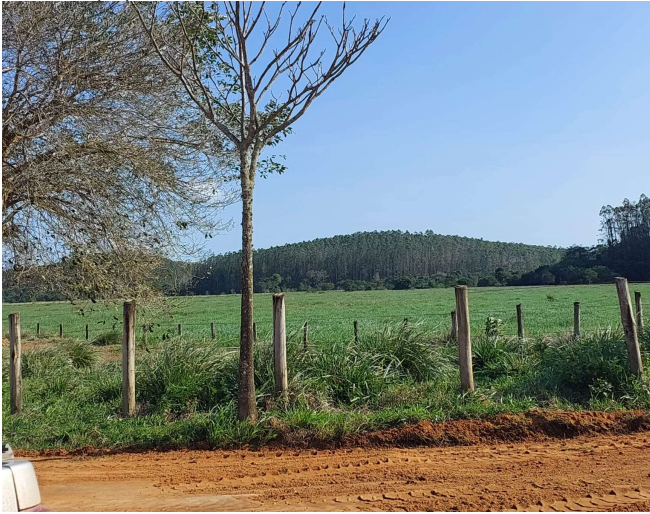
(A) Vista do Ponto 1 dos Talhões