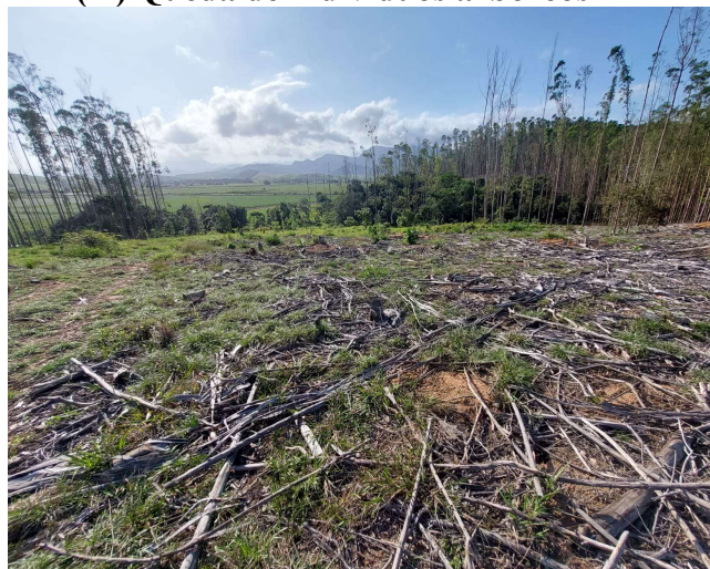
(H) Queda de indivíduos arbóreos