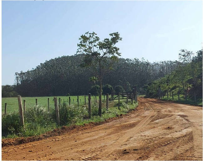
(B) Vista do Ponto 2 dos Talhões