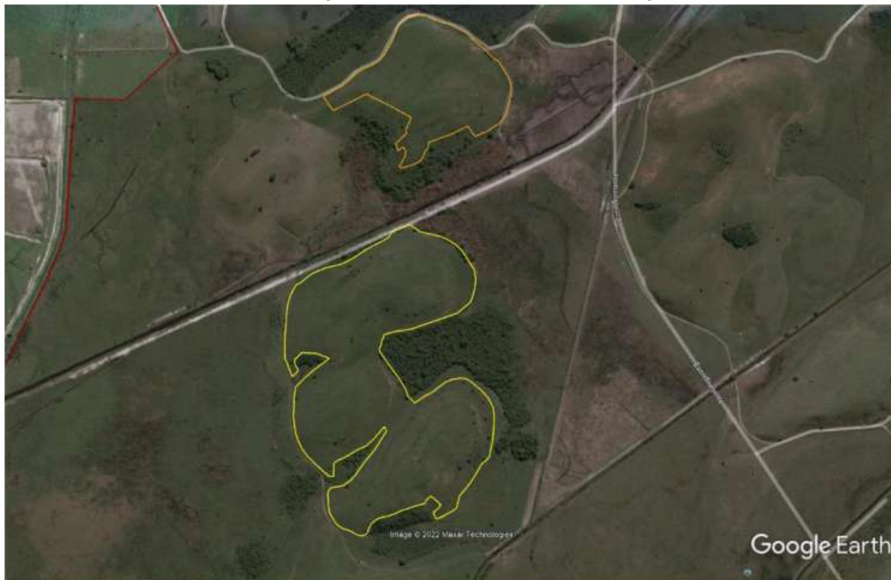
FIGURA 3: Delimitação das áreas destinadas à implantação do povoamento florestal, datada de janeiro de 2007. As áreas encontravam-se antropizadas, compostas por pastagem. Imagem extraída do Plano de Manejo anexado nos autos do processo.