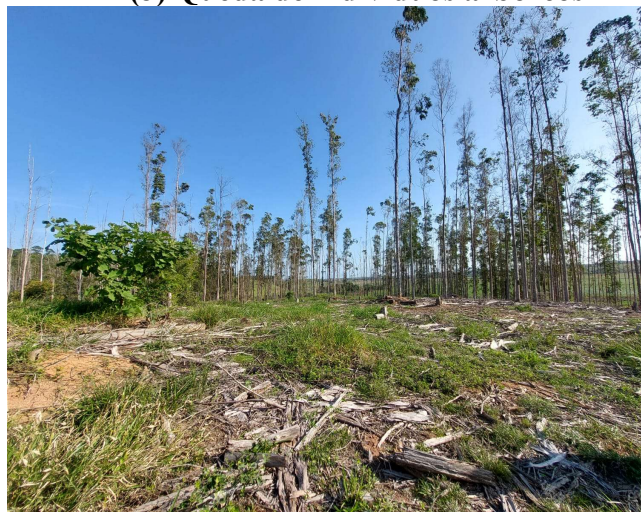
(J) Queda de indivíduos arbóreos