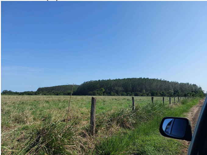
(C) Via de acesso ao Talhões