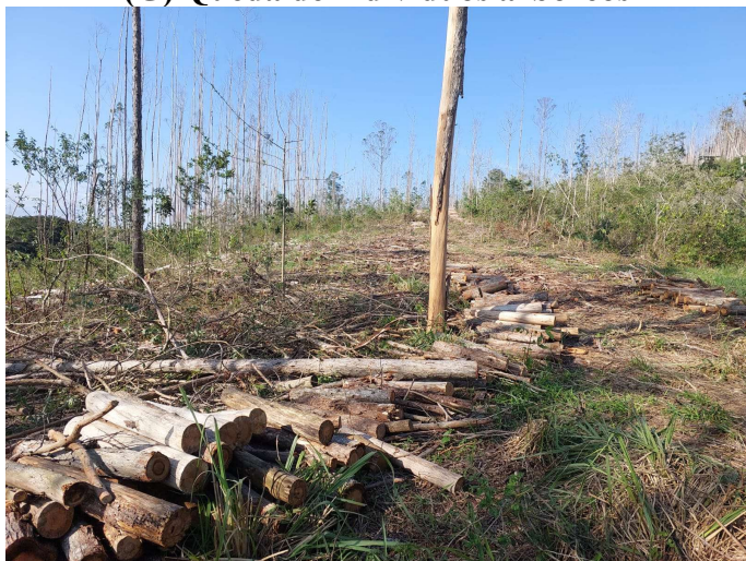
(G) Queda de indivíduos arbóreos