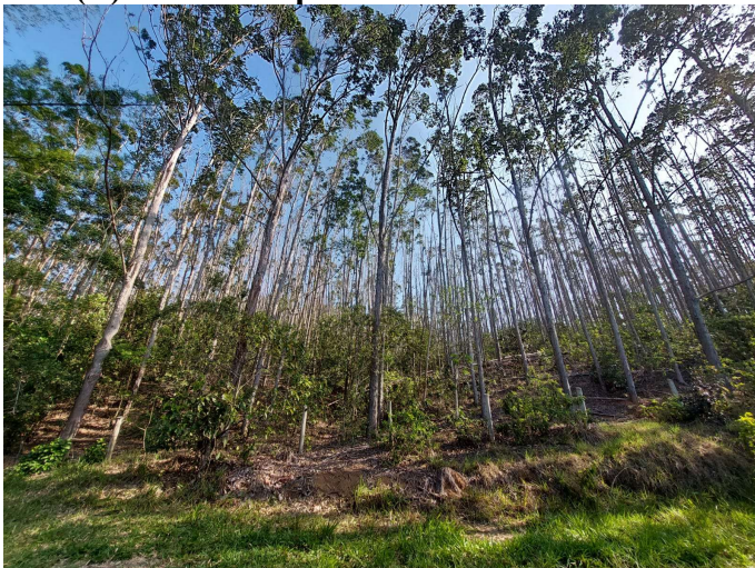
(E) Vista da espécie em desenvolvimento