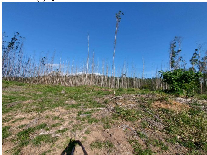
(I) Queda de indivíduos arbóreos