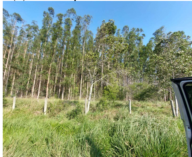
(D) Vista da espécie em desenvolvimento