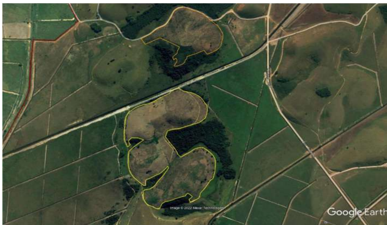
FIGURA 04: Delimitação das áreas destinadas à implantação do povoamento florestal, datada de junho de 2011, sendo possível notar o plantio recém executado. Imagem extraída do Plano de Manejo anexado nos autos do processo.