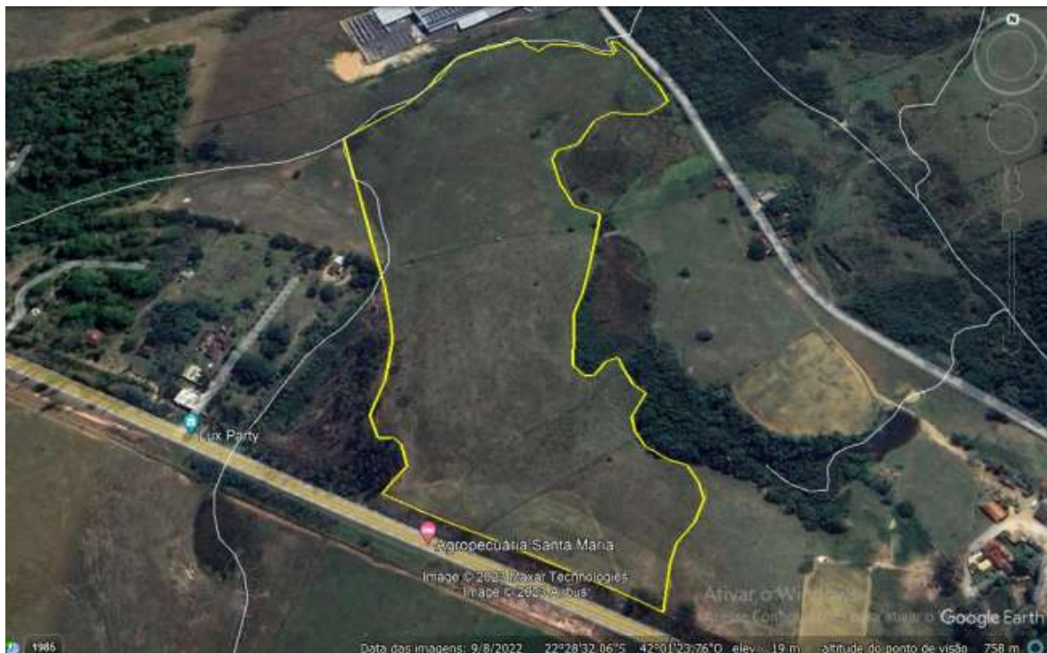
FIGURA 1: Localização da área de intervenção, imagem obtida pelo Programa Google Earth .