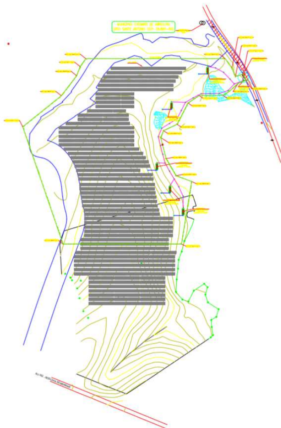
FIGURA 3: Desenho do projeto, respeitando a faixa marginal de proteção de 30 metros do corpo hídrico e dos espelhos d'água.