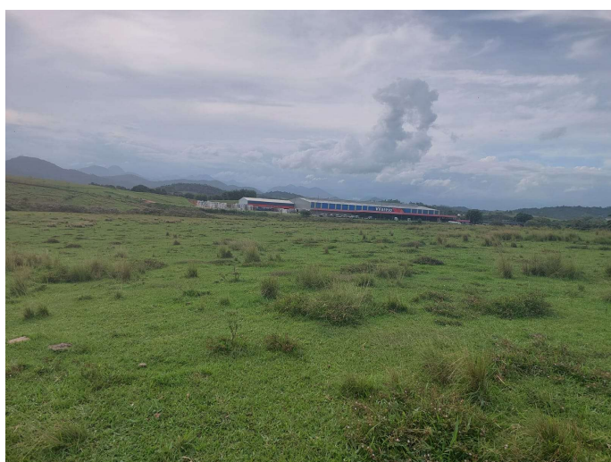
(B) Vista da área de implantação da usina fotovoltaica