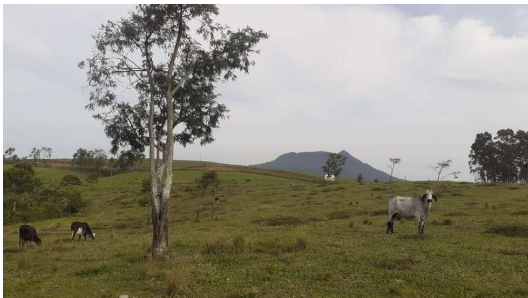
FIGURA 5: Registro fotográfico das árvores a serem suprimidas. ( Machaerium sp. )