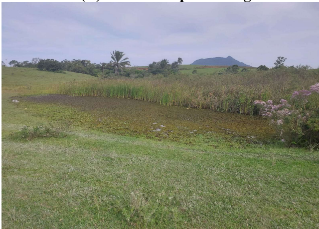
(G) Vista do corpo hídrico