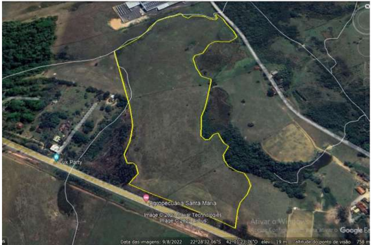
Figura 1: Planta de localização