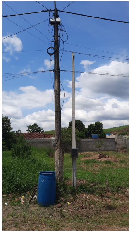
Imagem 3: Vista do Poste Padrão