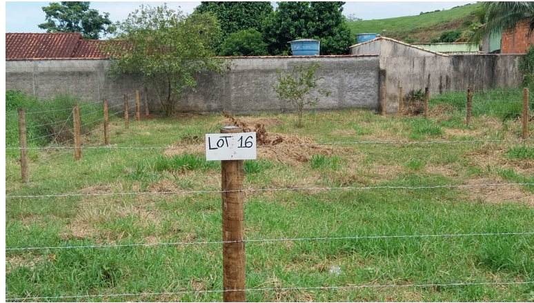
Imagem 02: Vista da propriedade.