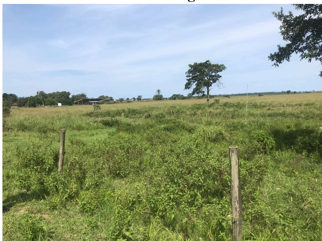
(A) Vista da área proposta para implantação da Estação de Tratamento de Água