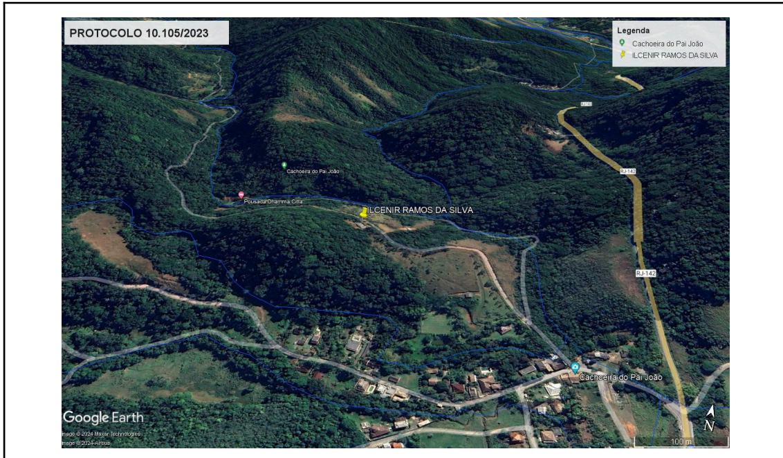
Figura 1: Localização da propriedade, imagem obtida através do Google Earth.