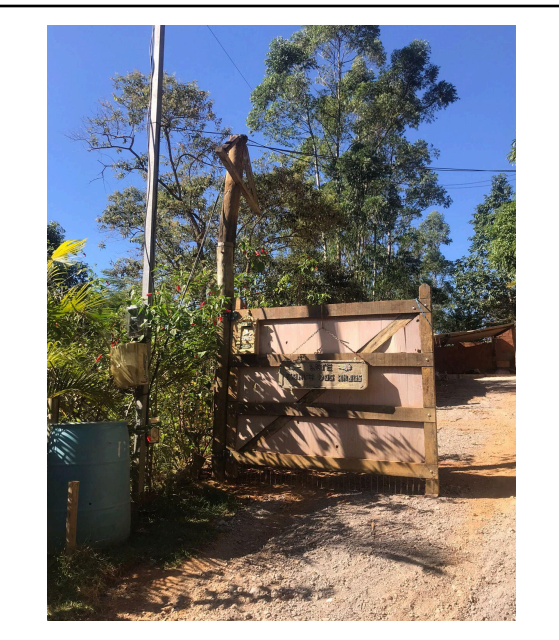
Figura 3: Fachada da propriedade.