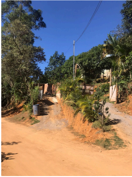
Figura 4: Vista geral do terreno.