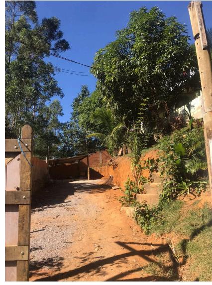
Figura 5: Fachada da propriedade.

Casimiro de Abreu, 21 de Agosto de 2024.